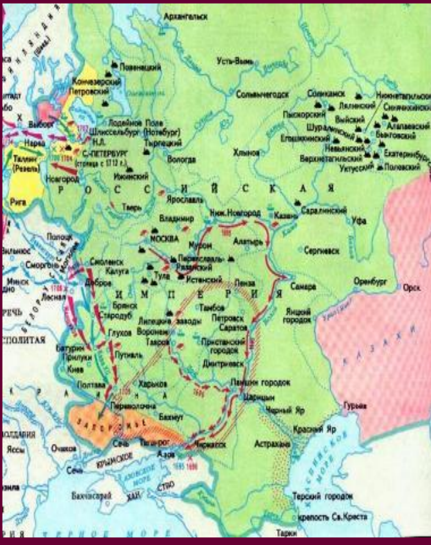
Центральная часть России в н. 18 века.

В торговле Петр придерживался принципов протекционизма и меркантилизма.