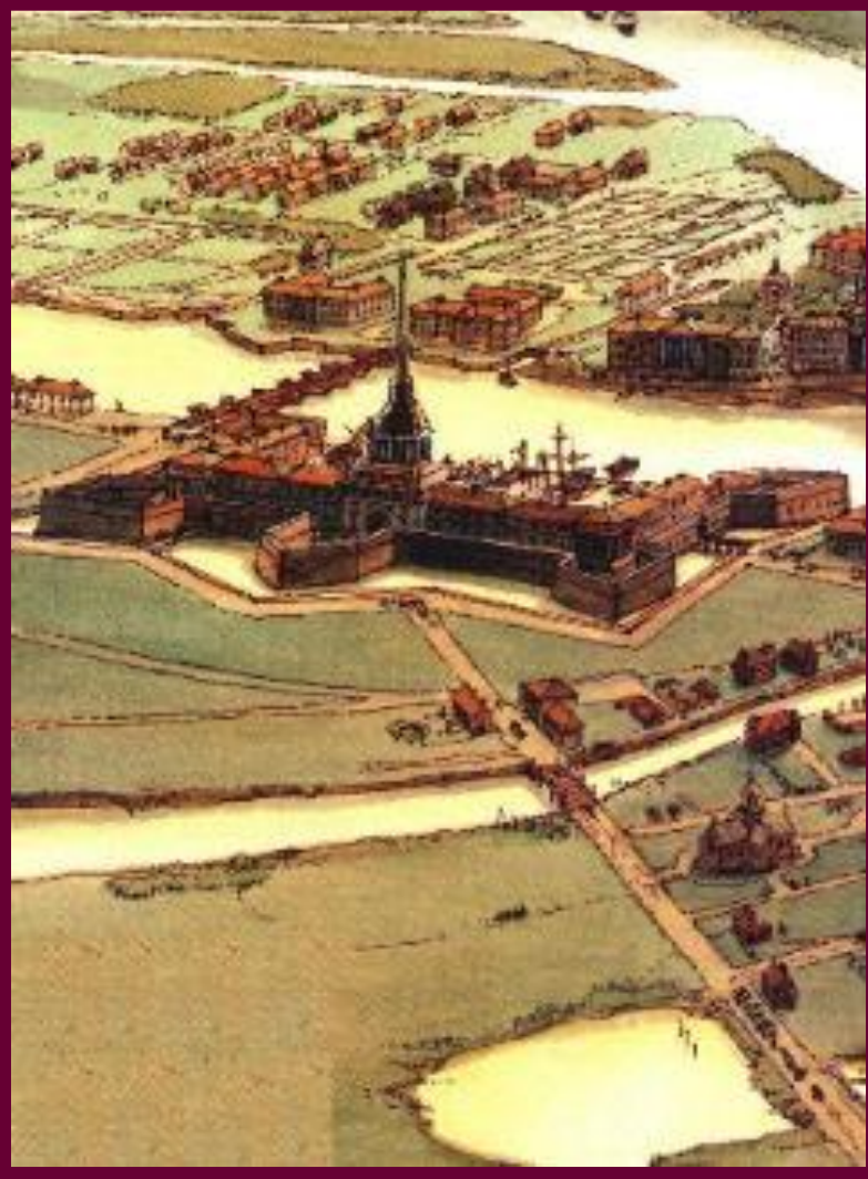
«Санкт-Петербург в 18 в». (Фрагмент).

Внутри страны торговля шла не только на сельских торжках, но и на крупных ярмарках. Для облегчения торговли были построены Вышневолоцкой и Ладожский каналы.