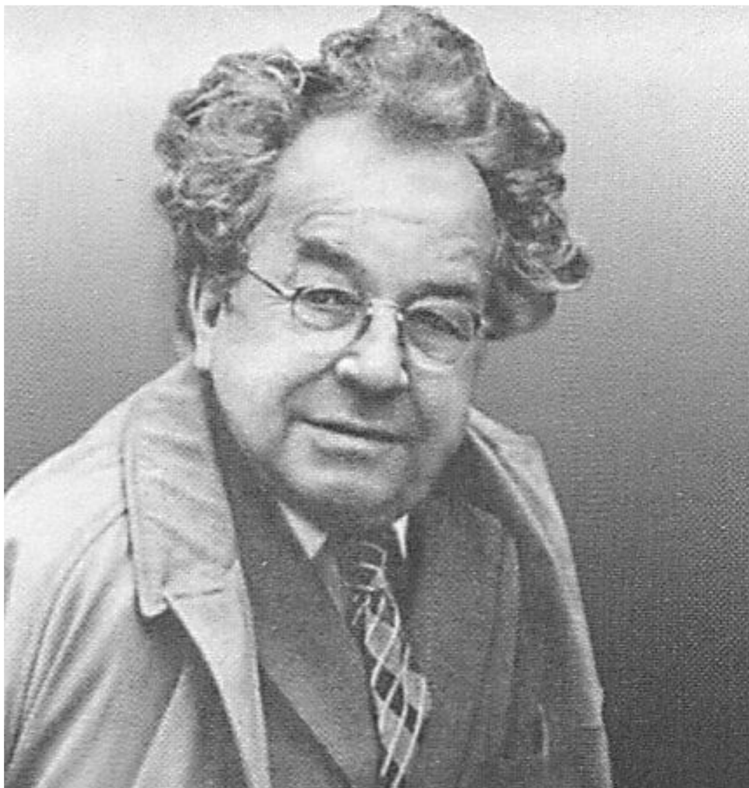
Евгений Андреевич Пермяк (1902-1982).