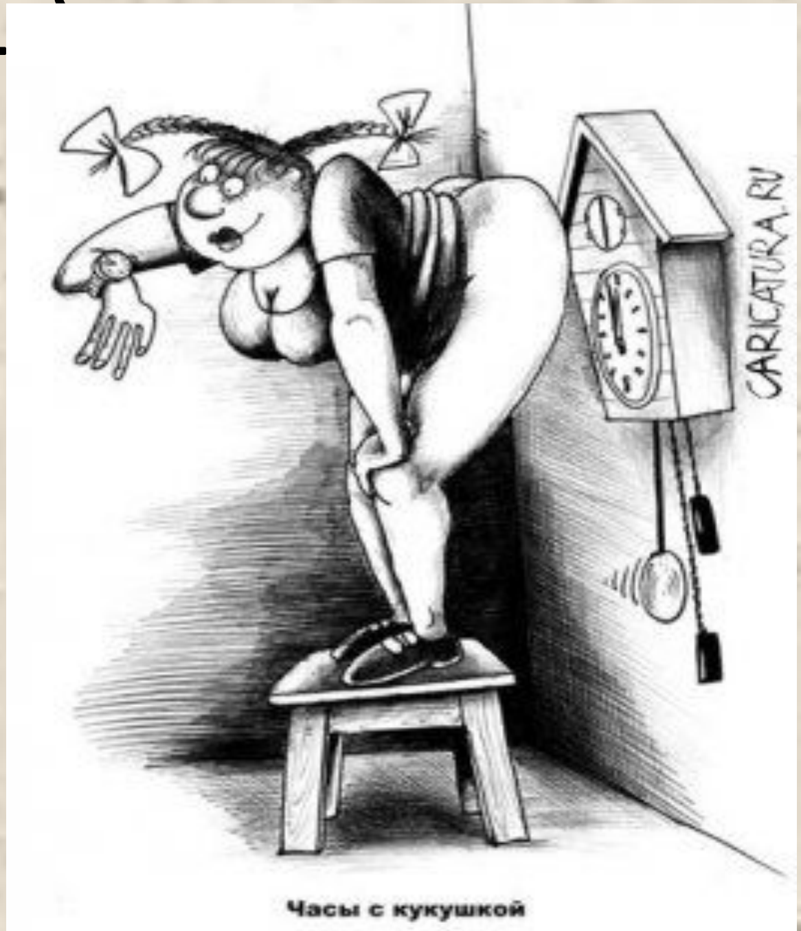
Часы с кукушкой