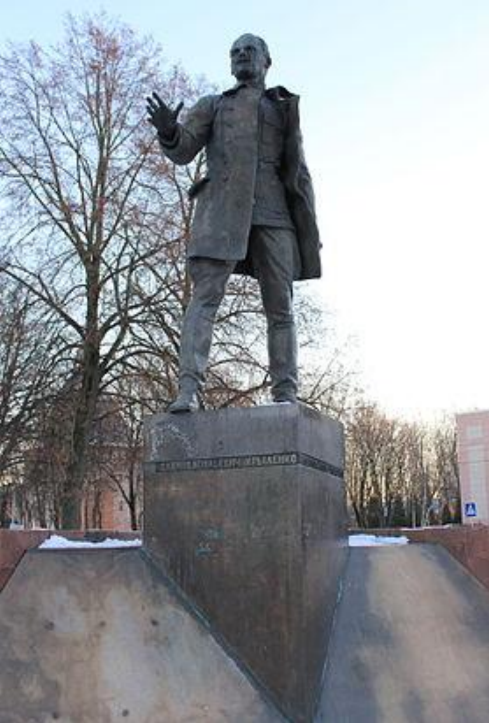
ПАМЯТНИК Н.В. КРЫЛЕНКО (1985)