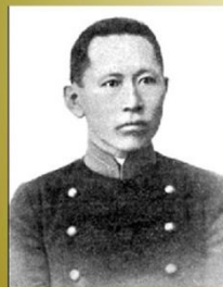
Гомбожаб Цэбекович Цыбиков

Путешественник, этнограф, востоковед, буддолог, государственный и общественный деятель Российской империи, СССР и Монголии, переводчик, профессор ряда университетов.