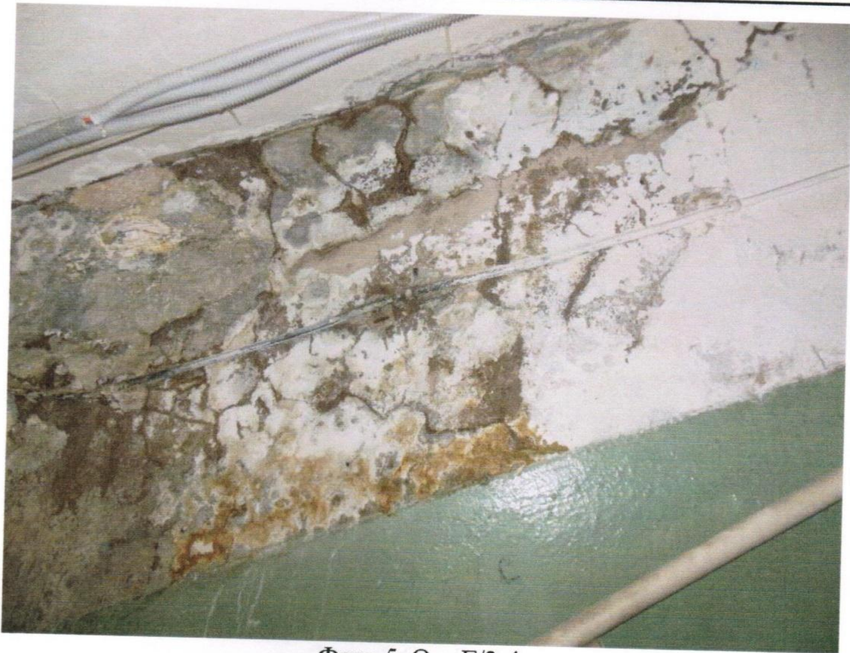
Φωτο 5 Οστ Γ/3-4