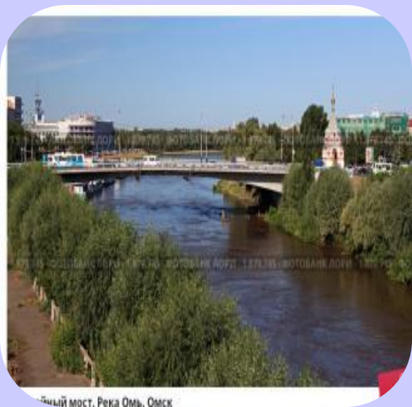
Бумажный мост, Река Омь, Омск