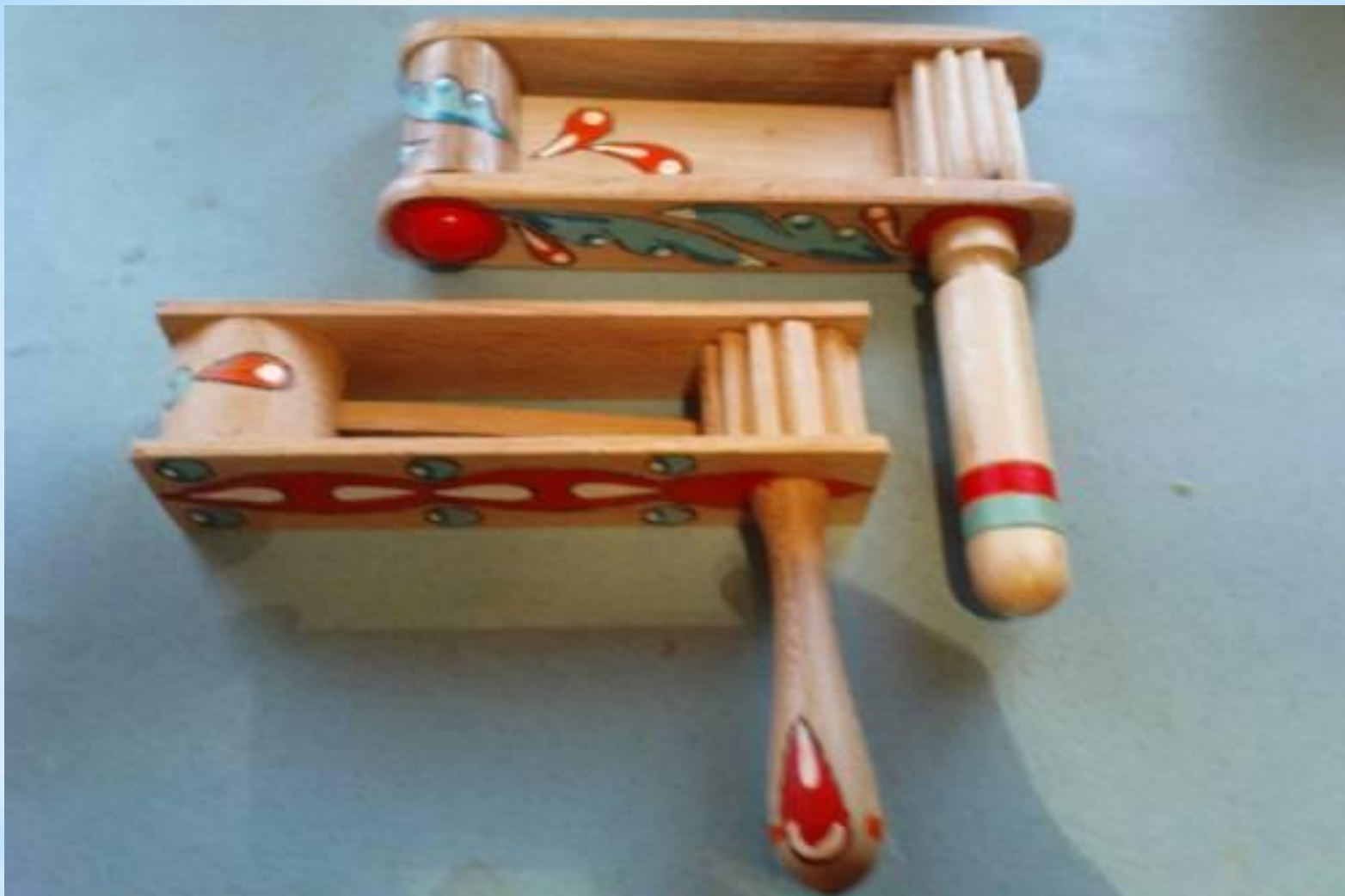
* ТРЕЩЕТКА игрушка славян