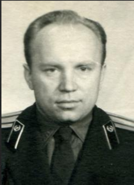
Витаутас Василяускас, полковник КГБ в отставке, гражданин Литовской Республики