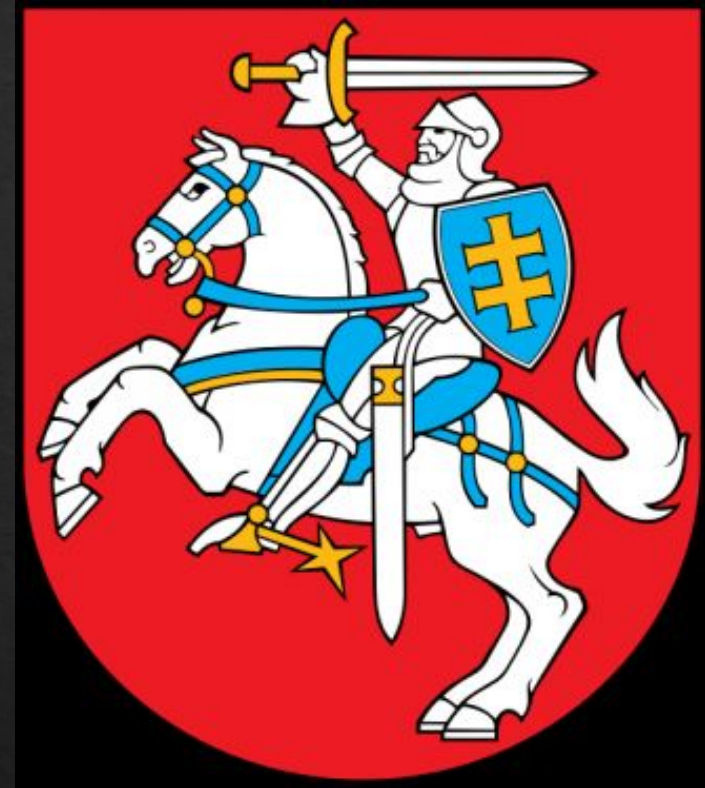
Литовская Республика (в лице Правительства Литовской Республики)