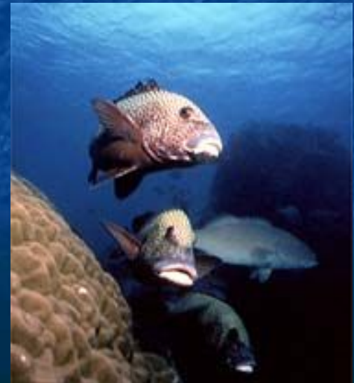
Большой Барьерный риф