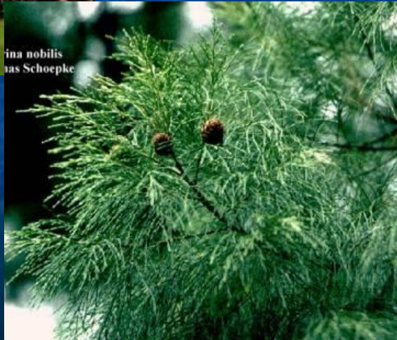
ina nobilis as Schoepke