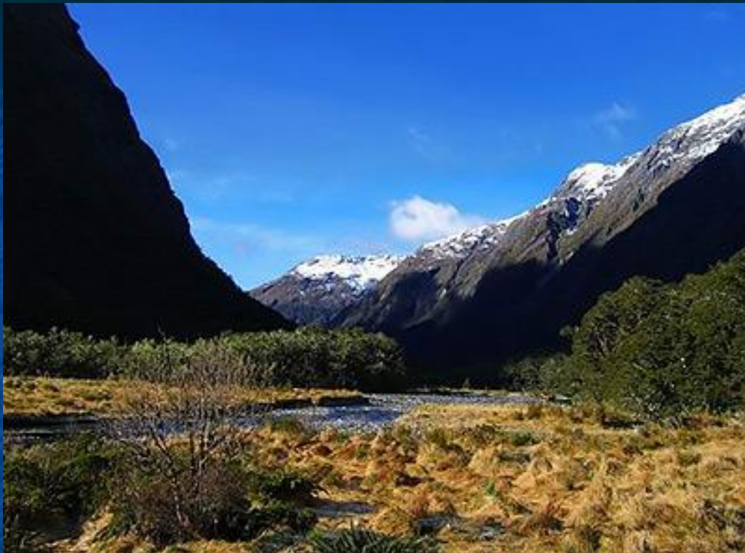
Большой Водораздельный хребет