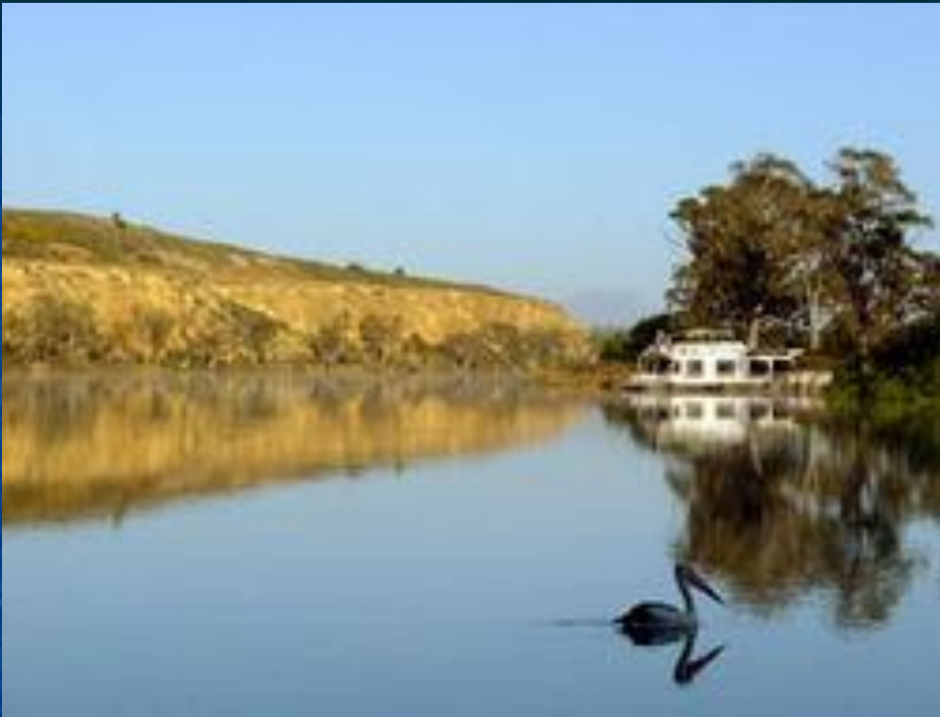
Река Муррей с притоком Дарлинг