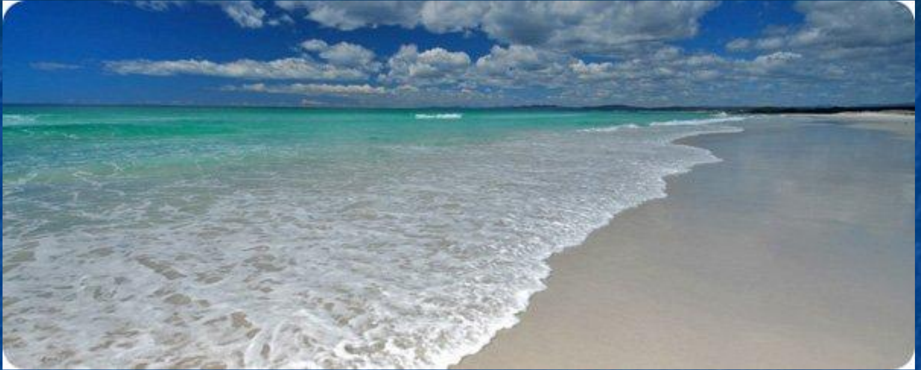
Большой Австралийский залив