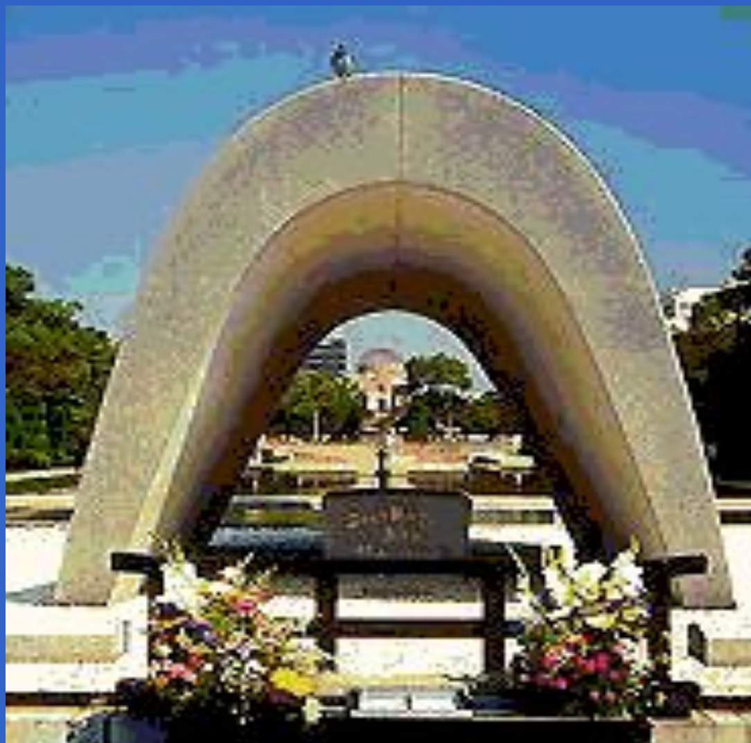
Мемориальный парк мира. Хиросима