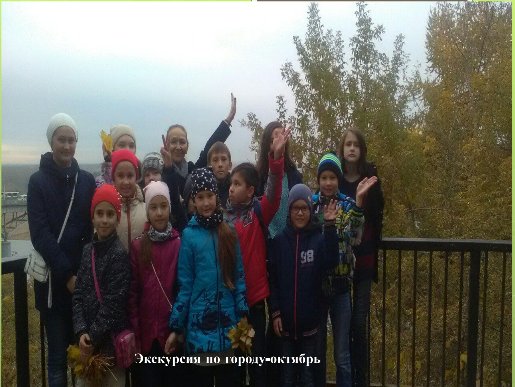
Экскурсия по городу-октябрь