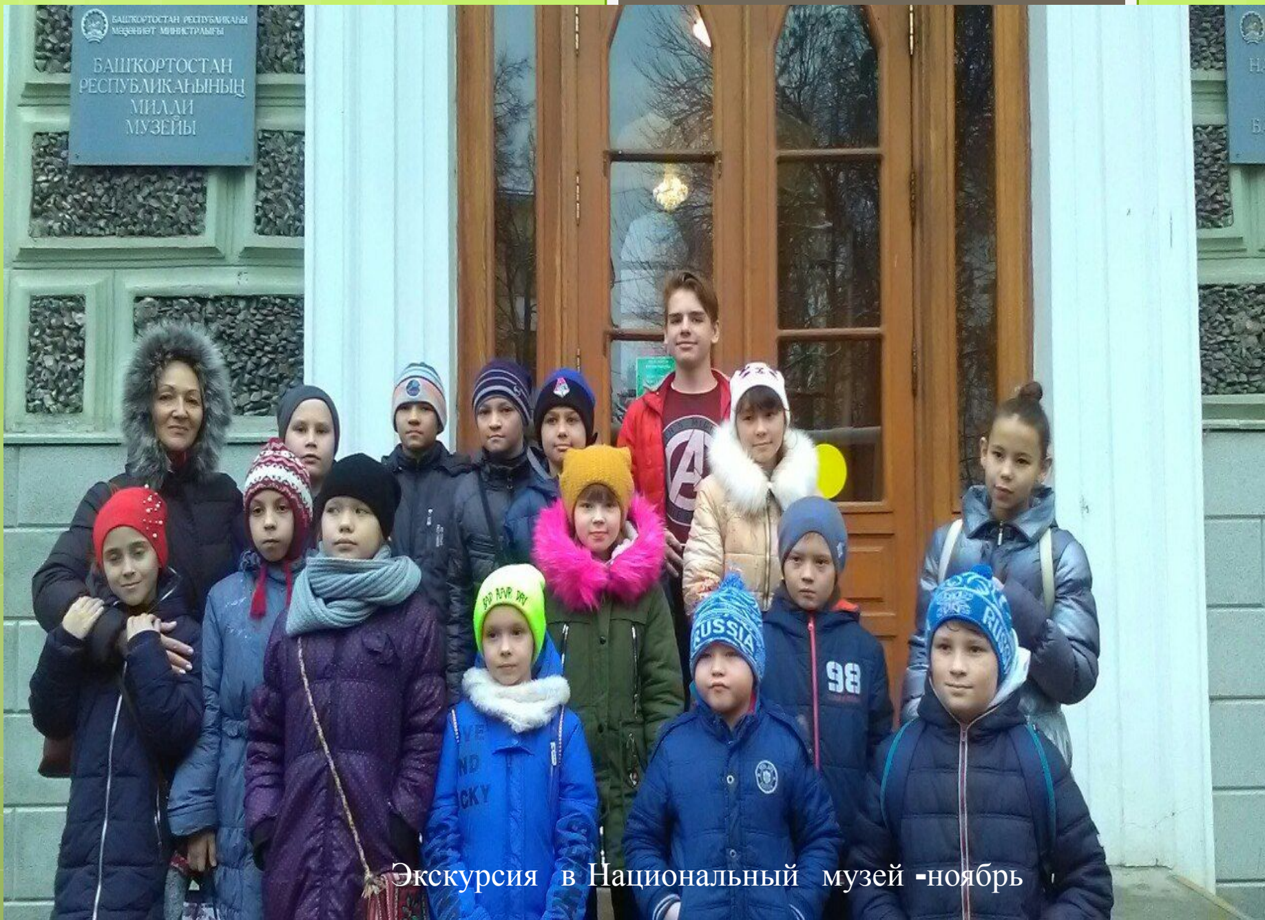
Экскурсия в Национальный музей -ноябрь