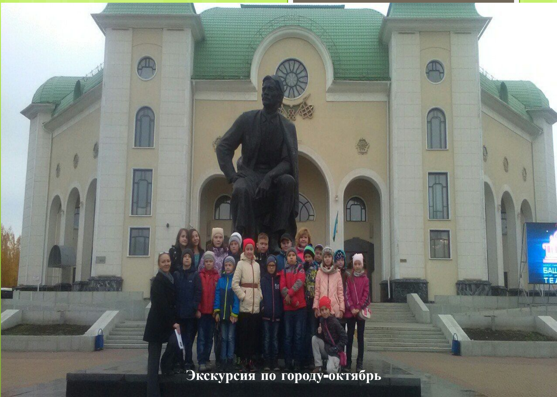
Экскурсия по городу-октябрь