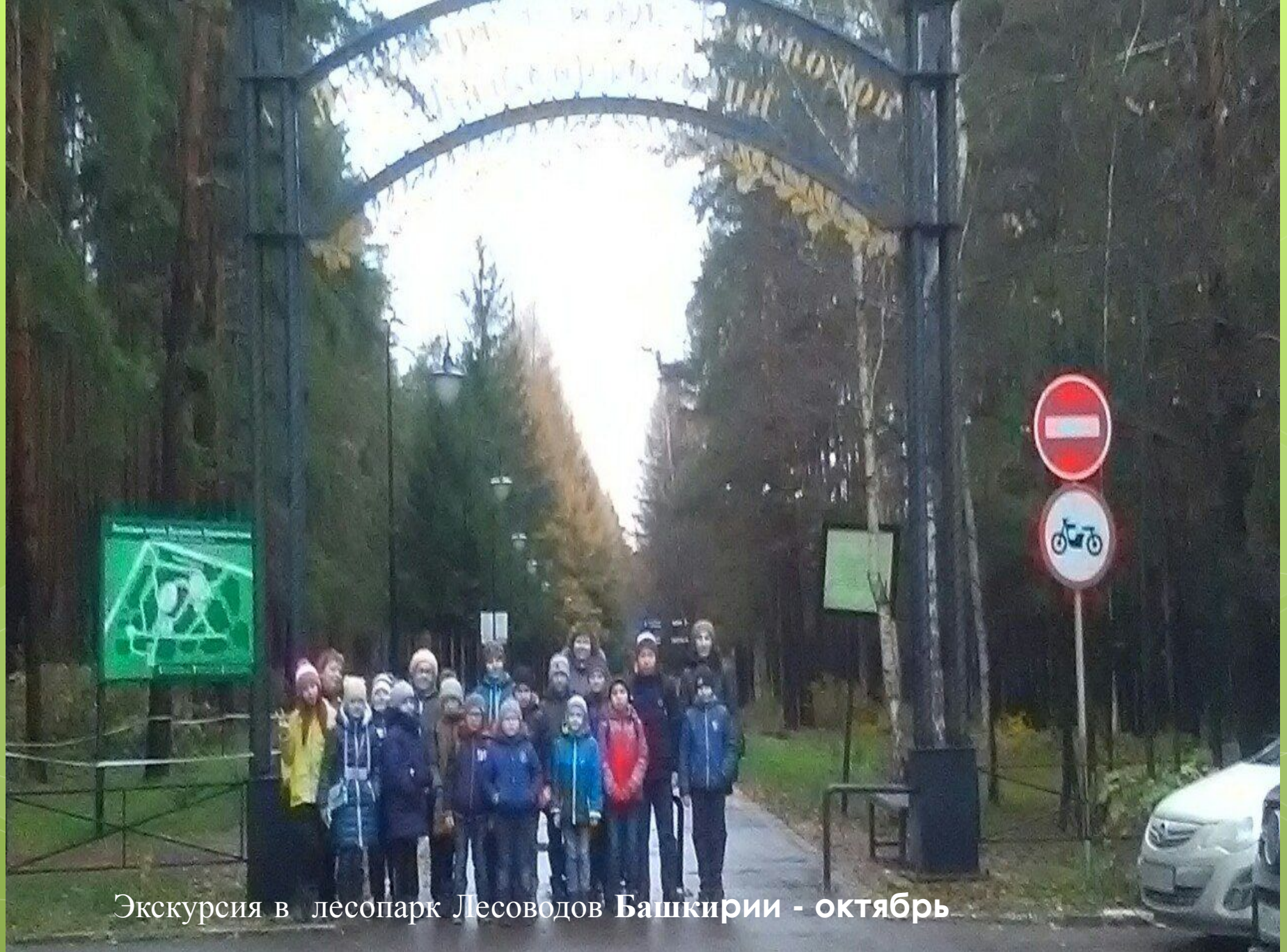
Экскурсия в лесопарк Лесоводов Башкирии - октябрь