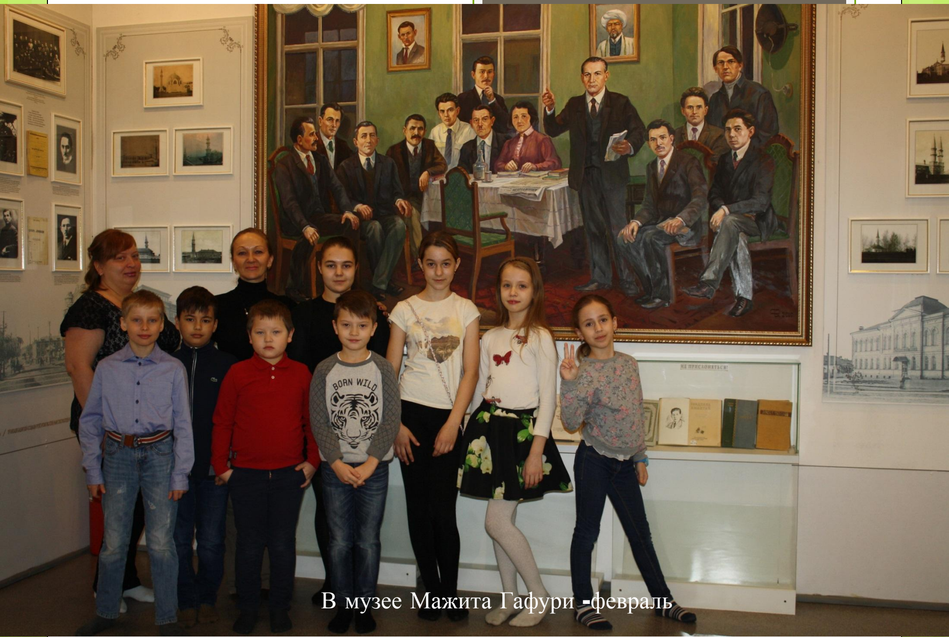
В музее Мажита Гафури - февраль