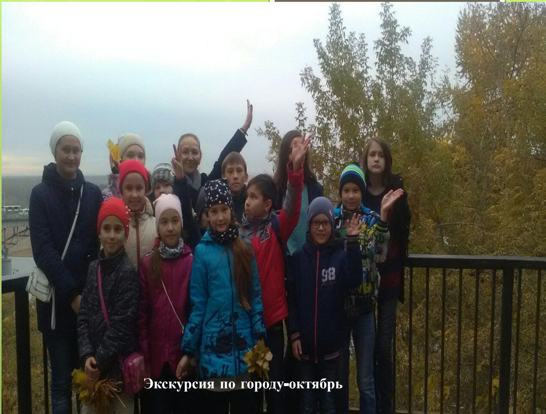
Экскурсия по городу-октябрь