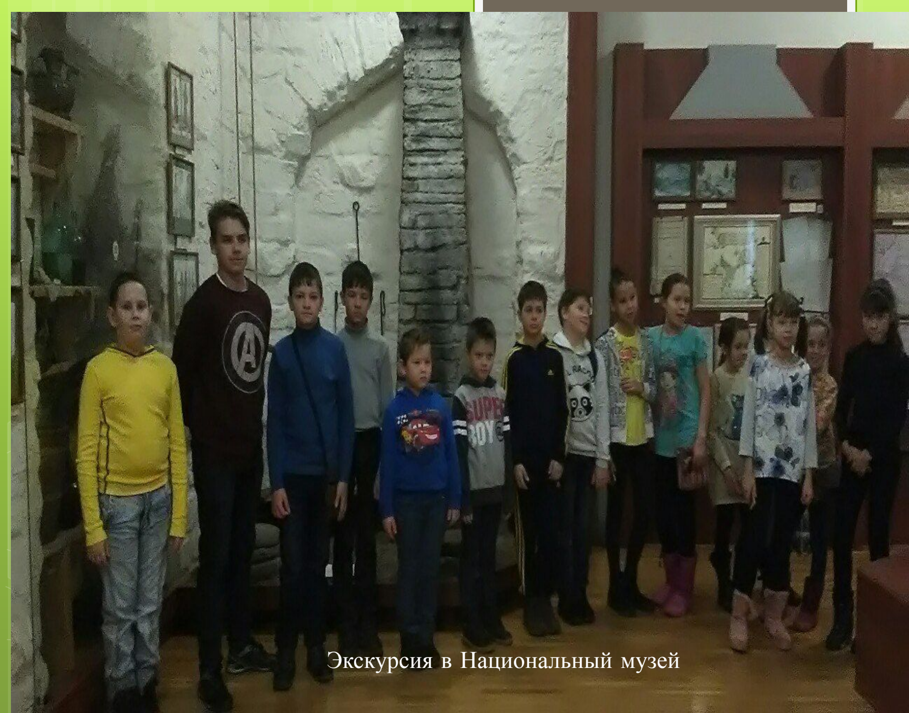
Экскурсия в Национальный музей