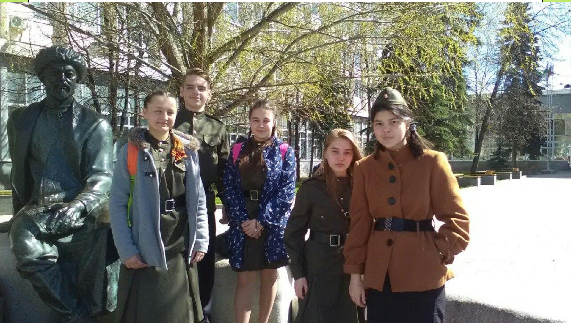
Литературно-краеведческая гостиная в национальной библиотеке памяти героев ВОВ - май