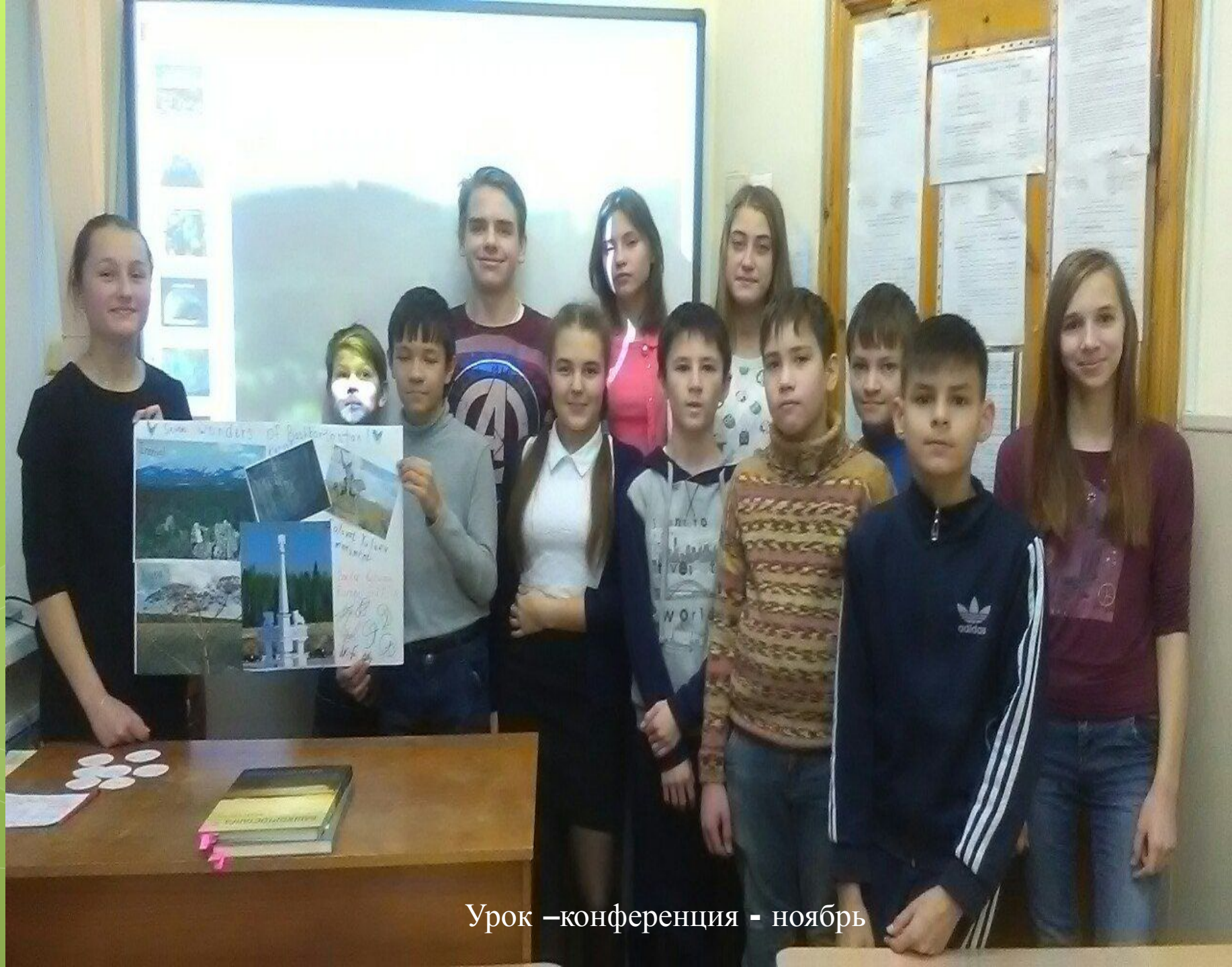
Урок –конференция - ноябрь