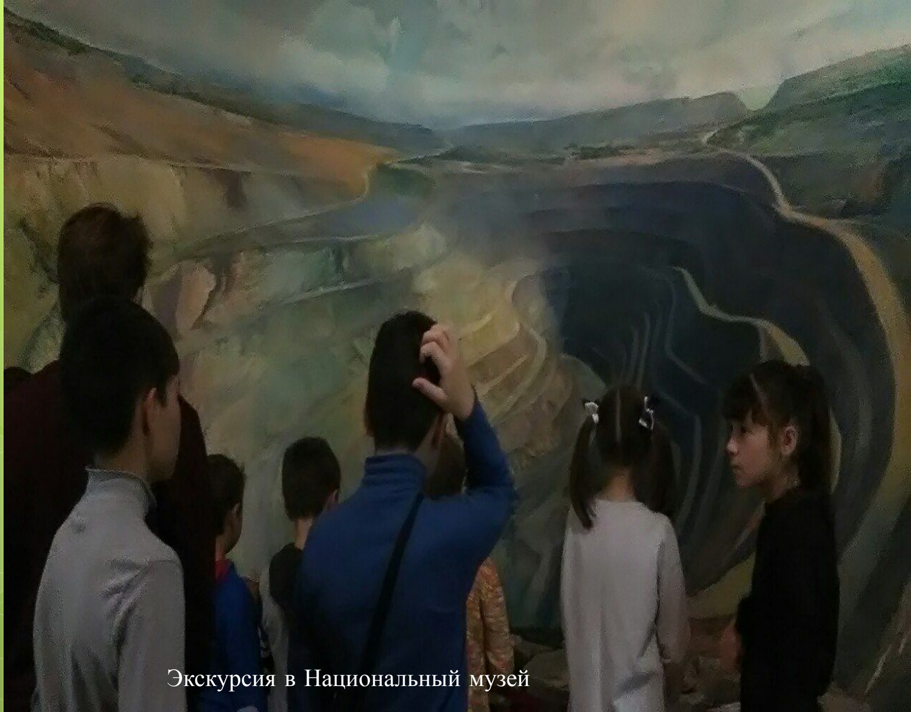
Экскурсия в Национальный музей