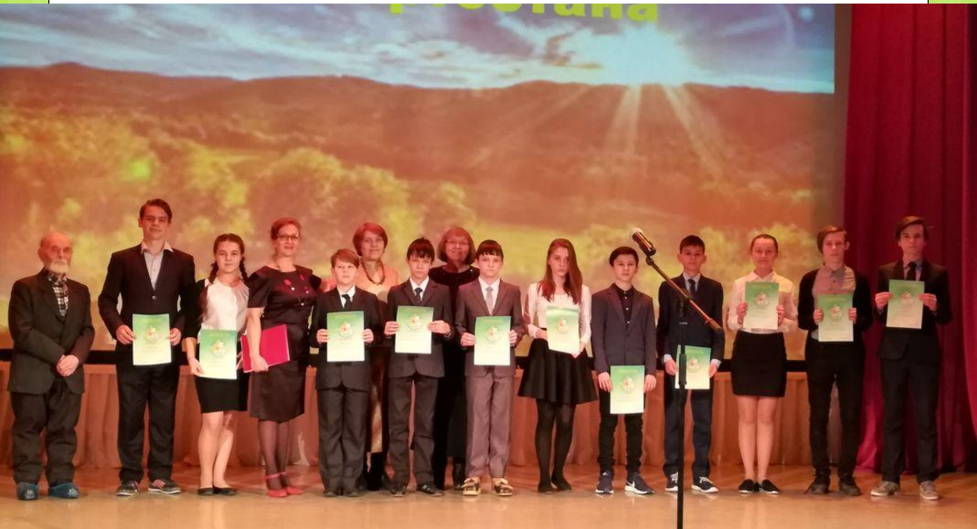
Литературно-краеведческая гостиная «Жемчужины Башкортостана» -март