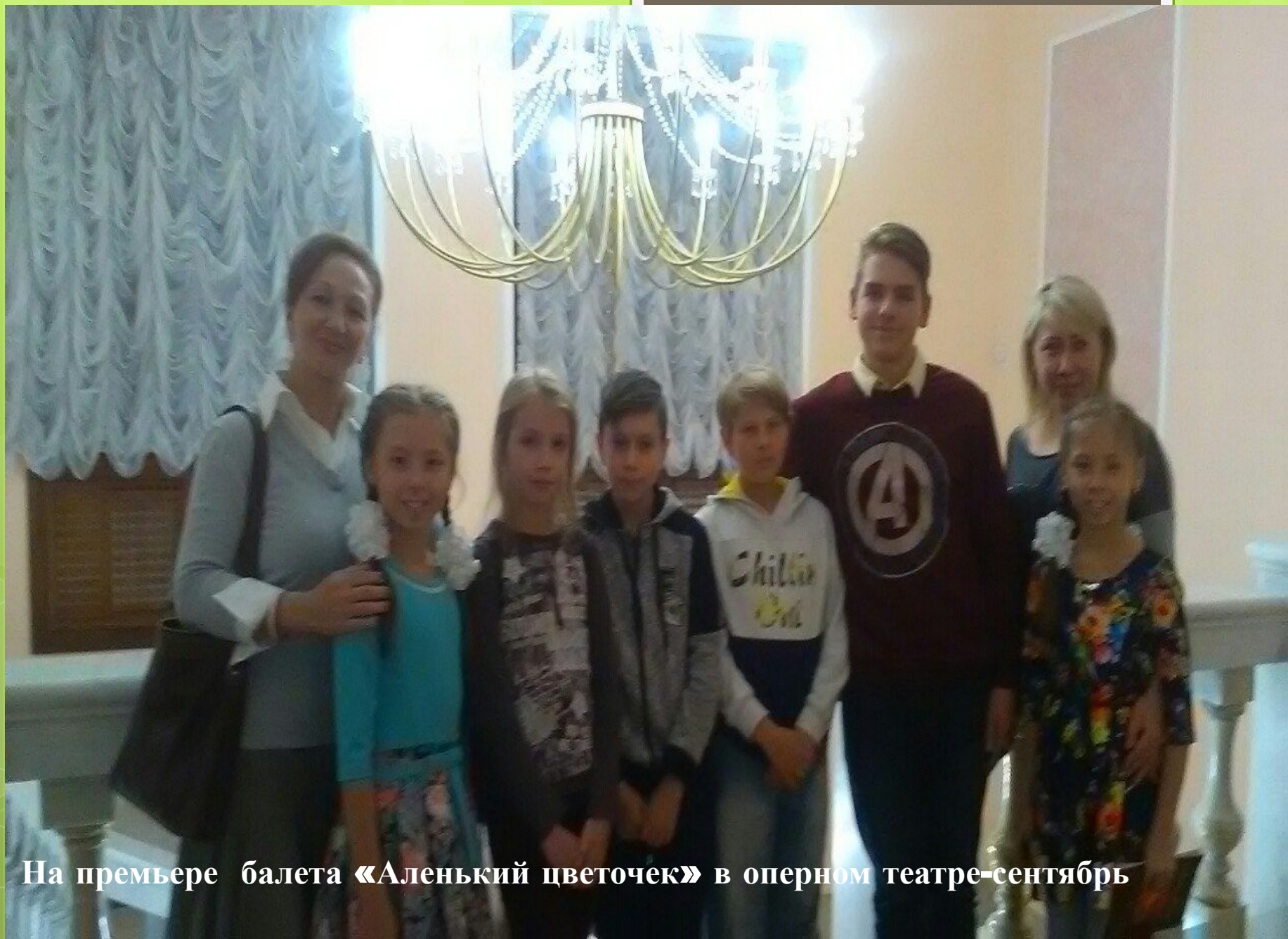
На премьере балета «Аленький цветочек» в оперном театре-сентябрь