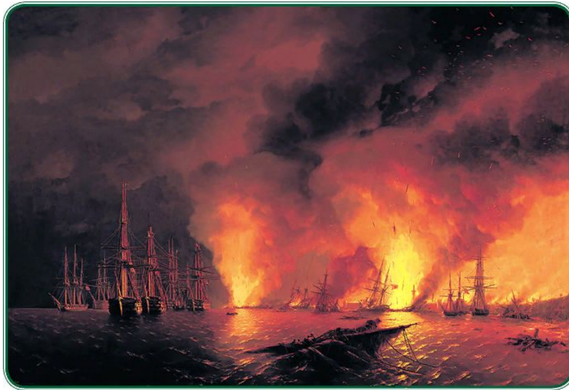
И. К. Айвазовский. Синопский бой (ночь после боя). 1853 г.

Сегодняшний День воинской славы — ещё один повод вспомнить героев далекой войны и обратиться к истории великих сражений русской армии.