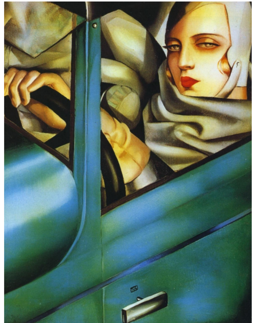
Tamara Łempicka Autoportret w zielonym bugatti , 1925