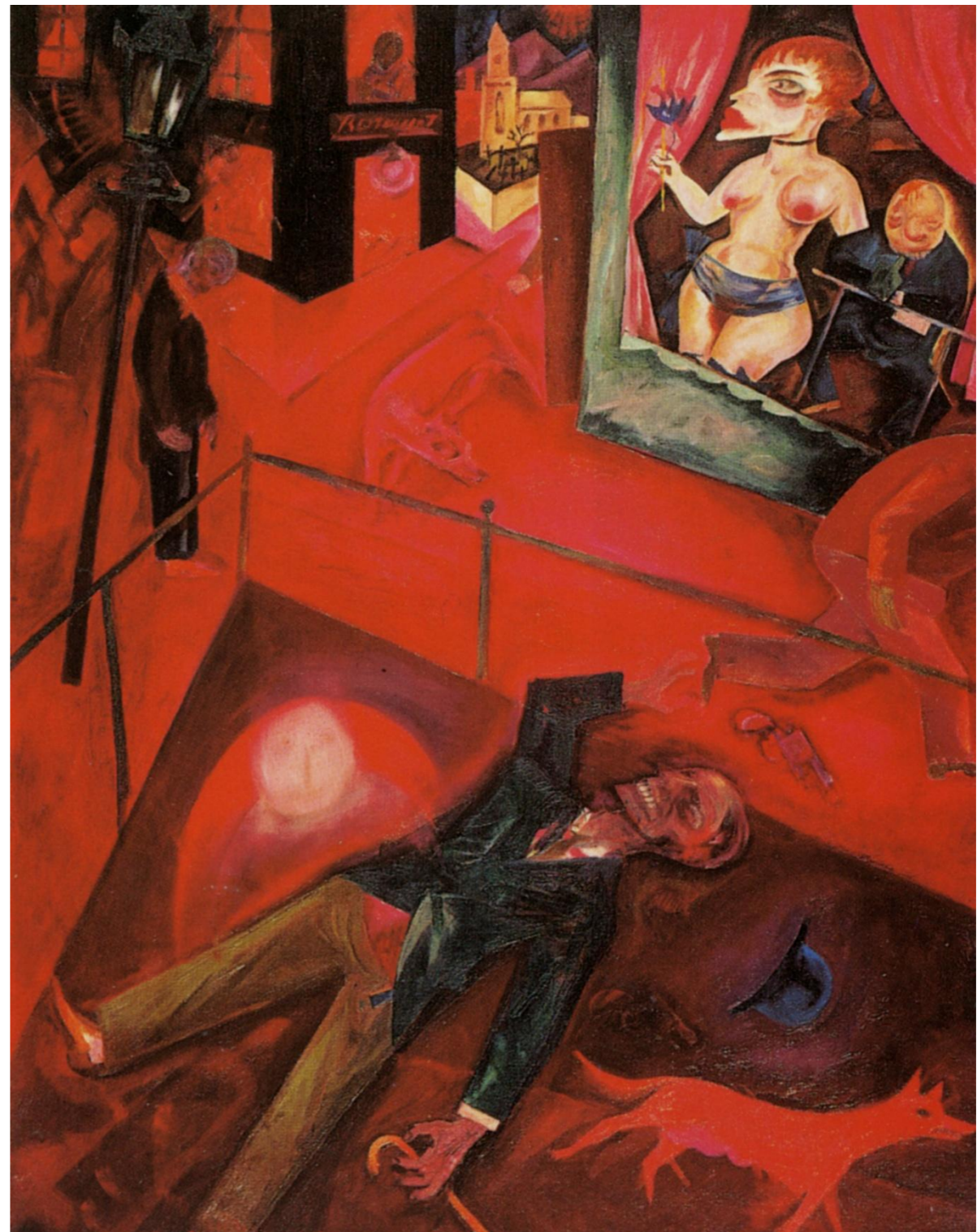
Georg Grosz Samobójstwo , 1916