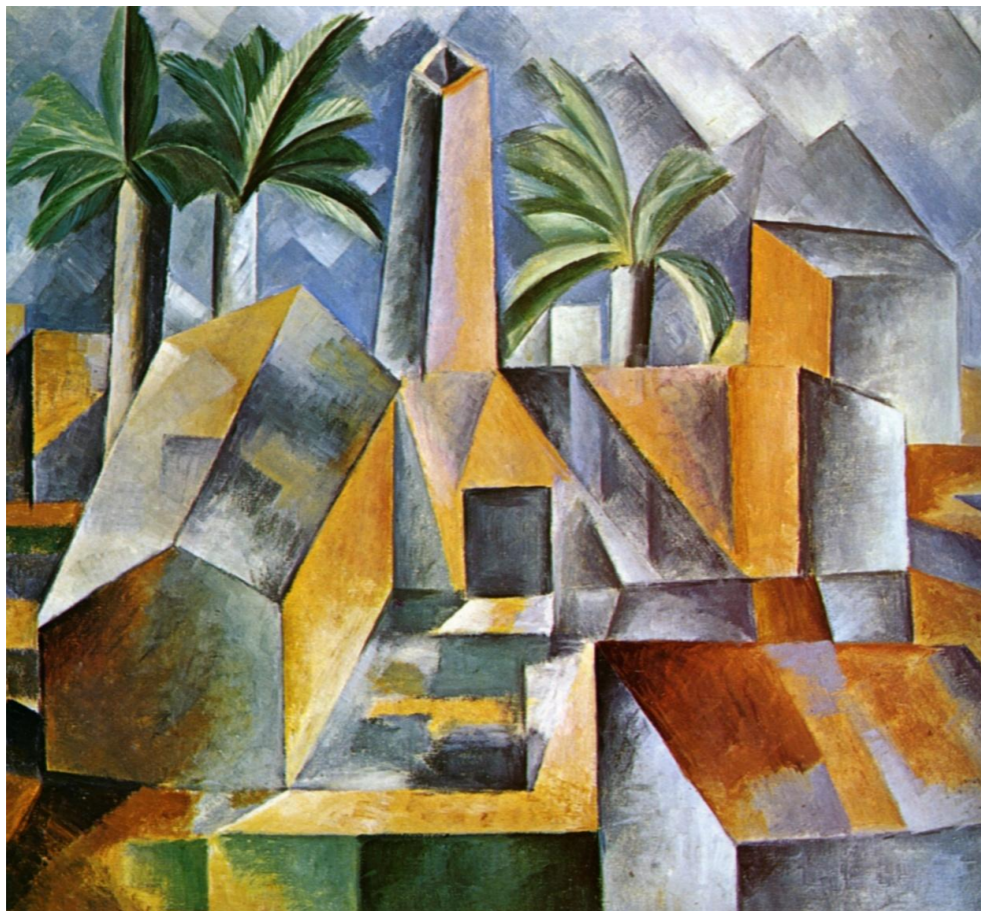
Pablo Picasso Fabryka Horta de Ebro , 1909