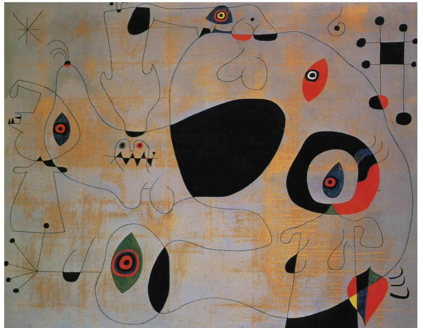
Joan Miró Port , 1945