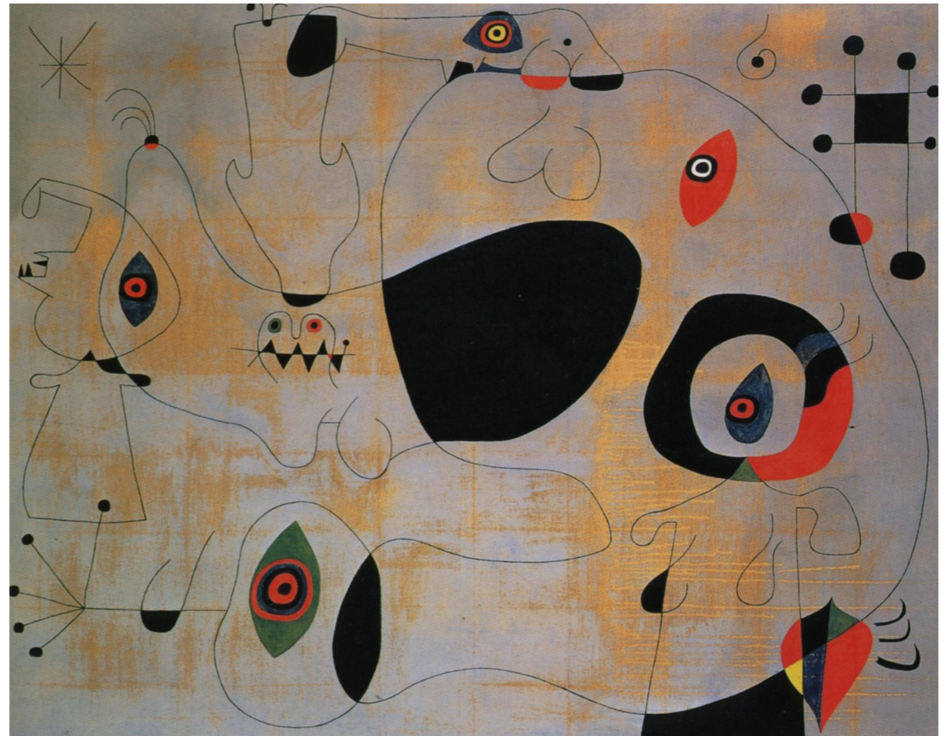
Joan Miró Port , 1945