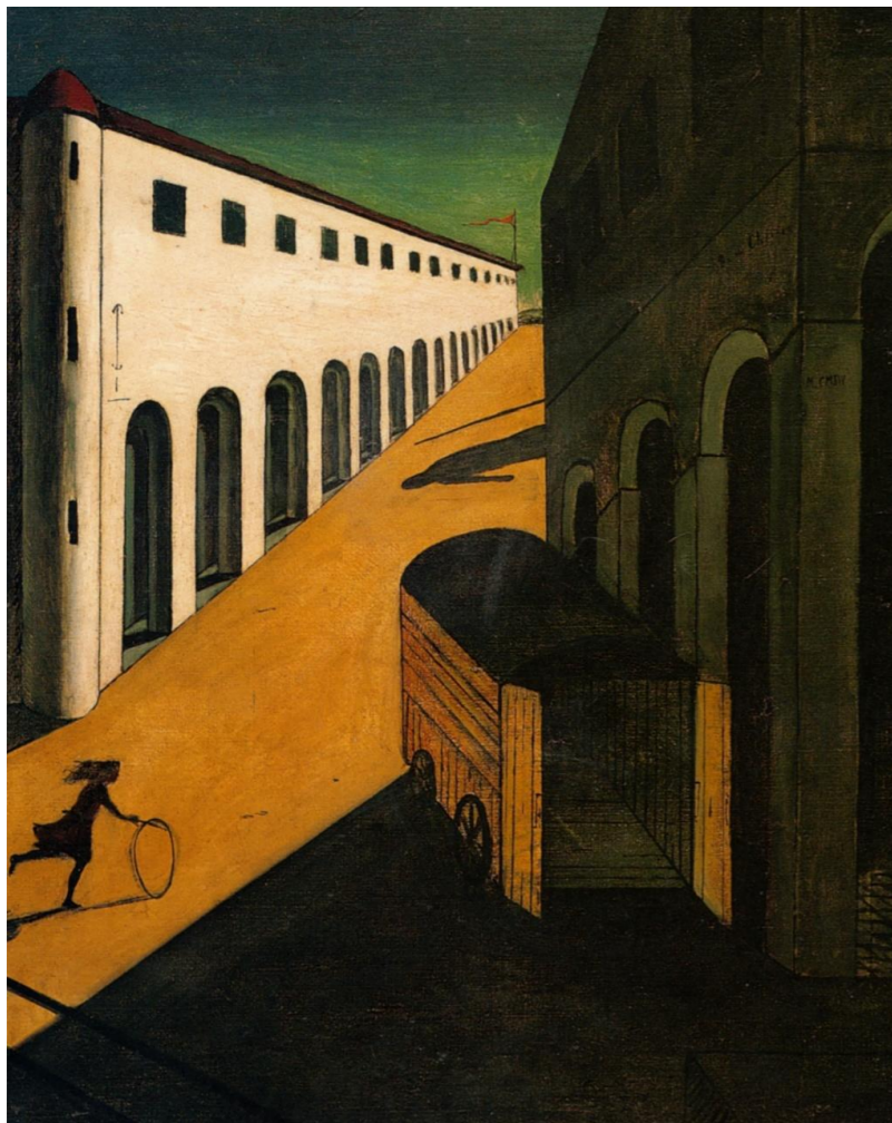
Giorgio de Chirico Melancholia i tajemnica , 1914