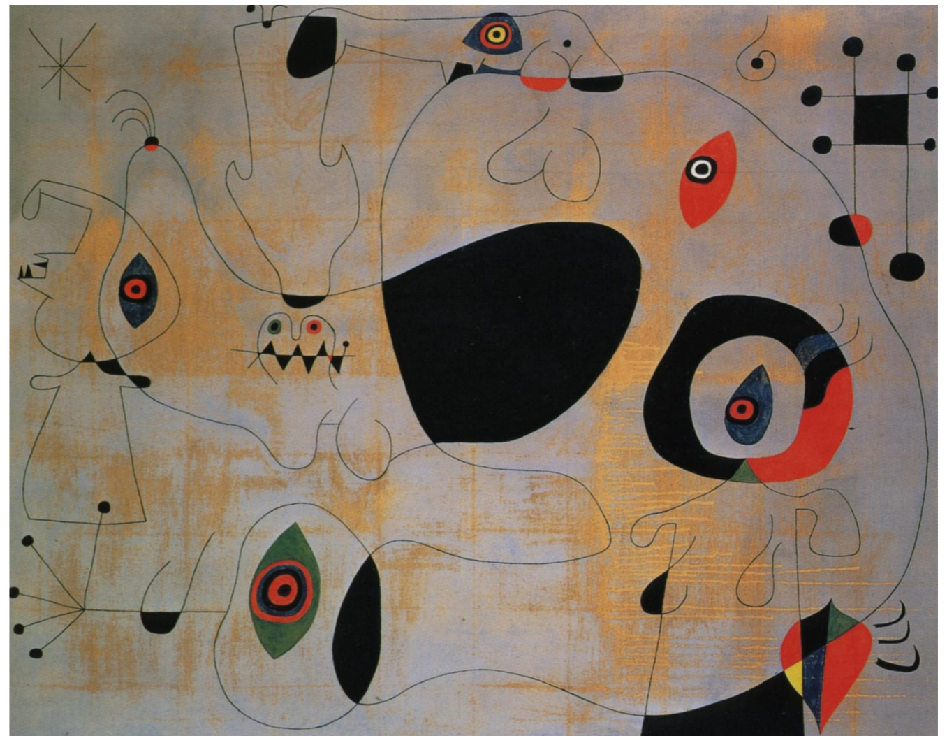
Joan Miró Port , 1945