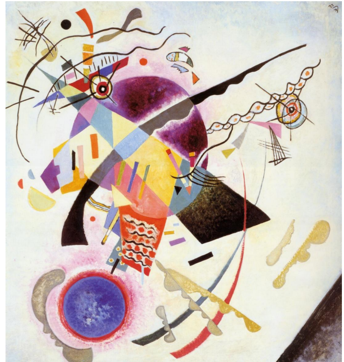
Wassily Kandinsky Błękitny okrąg , 1922