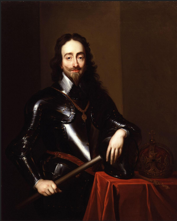
Карл I (1600 г. -1649 г.) годы правления - 1625 г. - 1649 г.