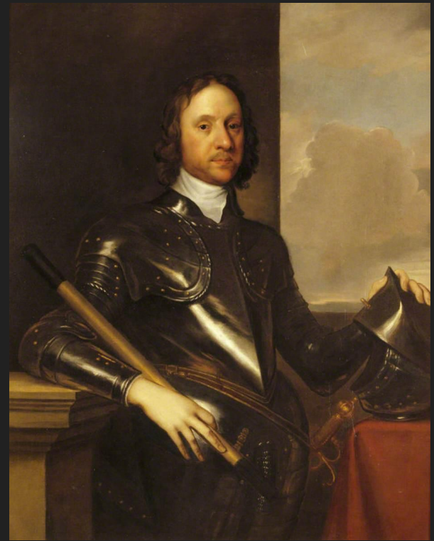
О.Кромвель (1599 г. - 1658 г.)