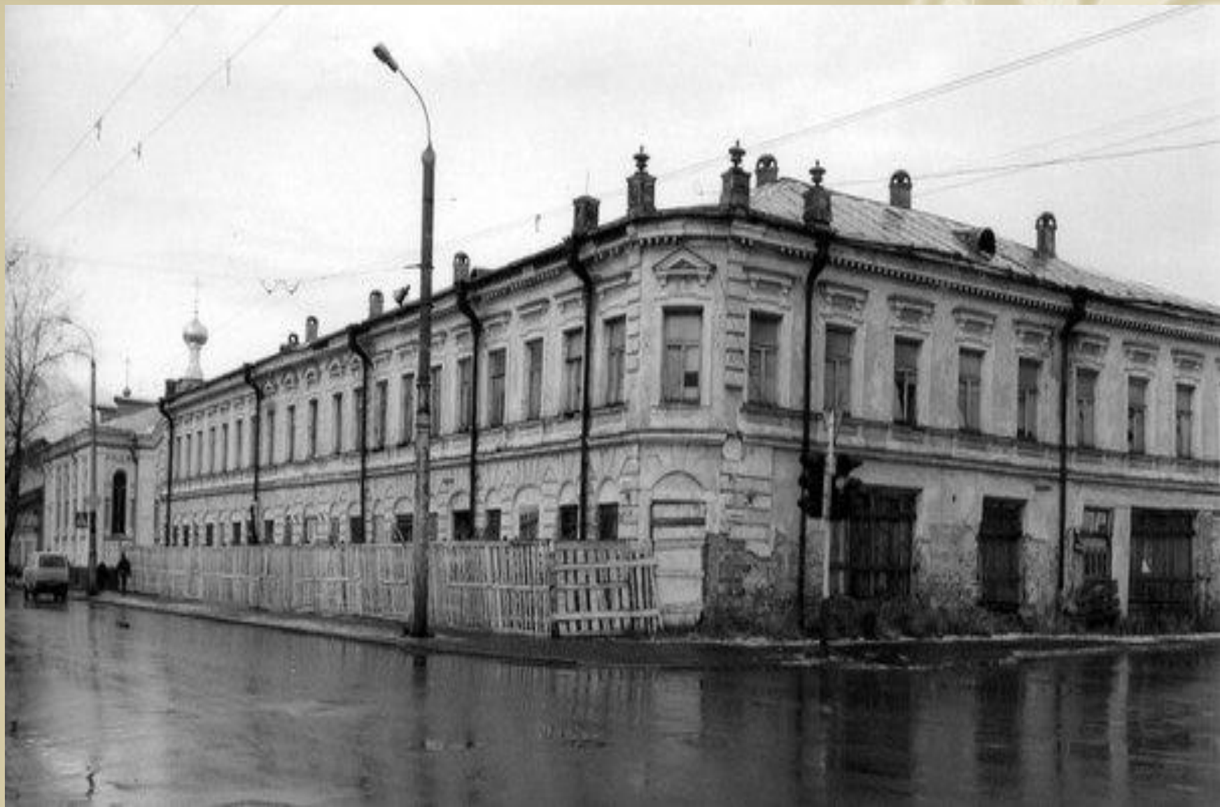
Бывший усадебный дом Плотниковой на реставрации. Фото 1990-х гг.