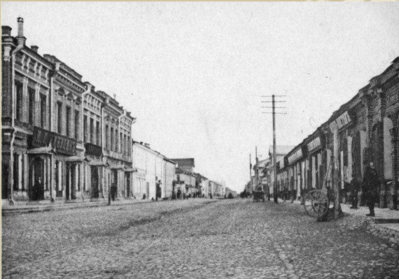
ул. Поморская. По обе стороны торговые здания Е.К. Плотниковой. Фото не ранее 1909 г.