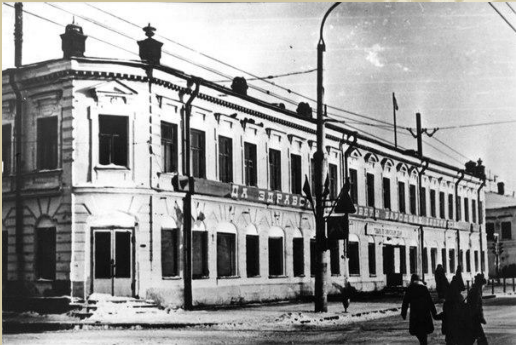
Октябрьский райисполком (бывший усадебный дом Плотниковой). Фото 1980-х гг.