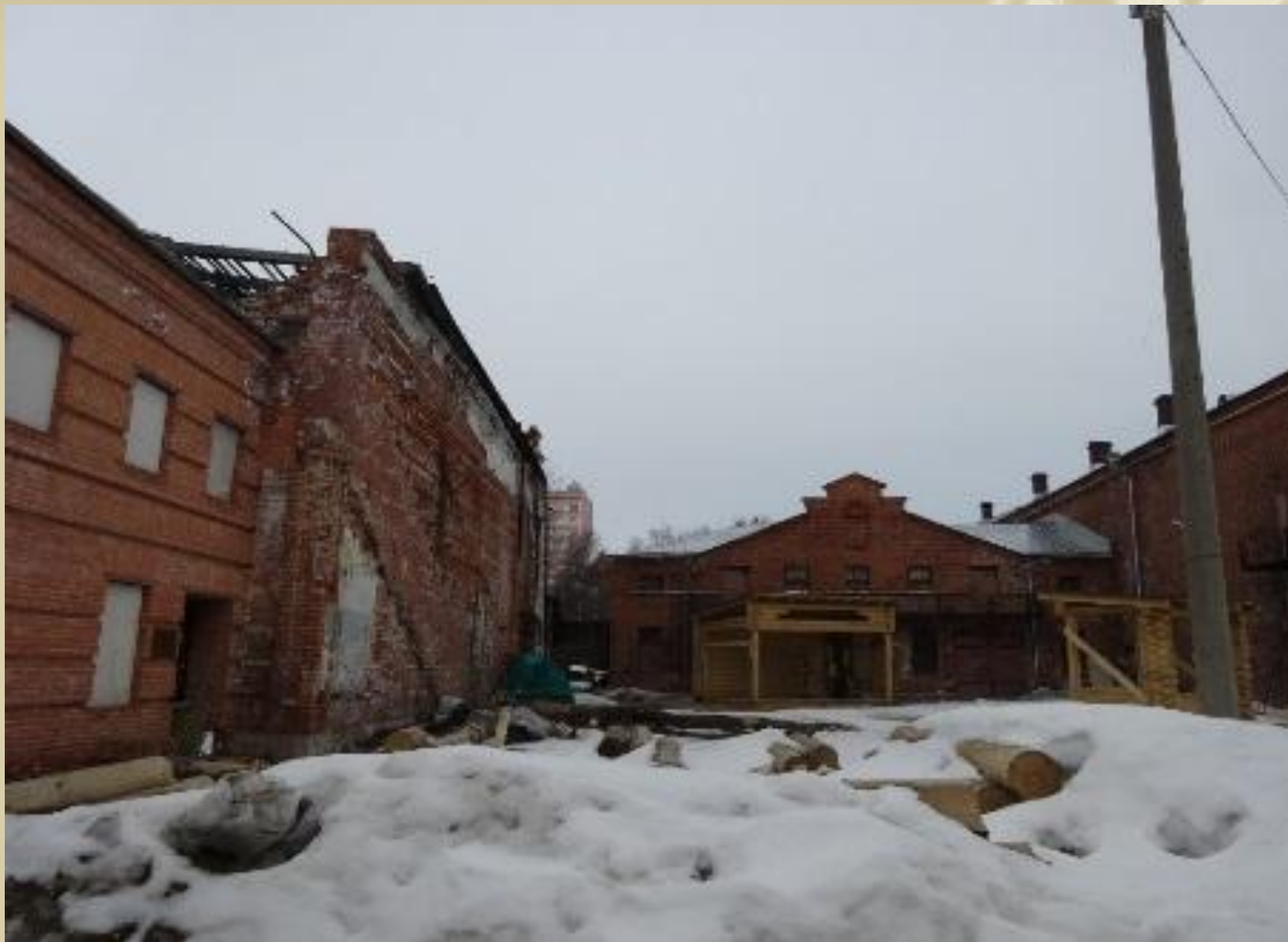
Торговое здание с каретным сараем фото 2014 года