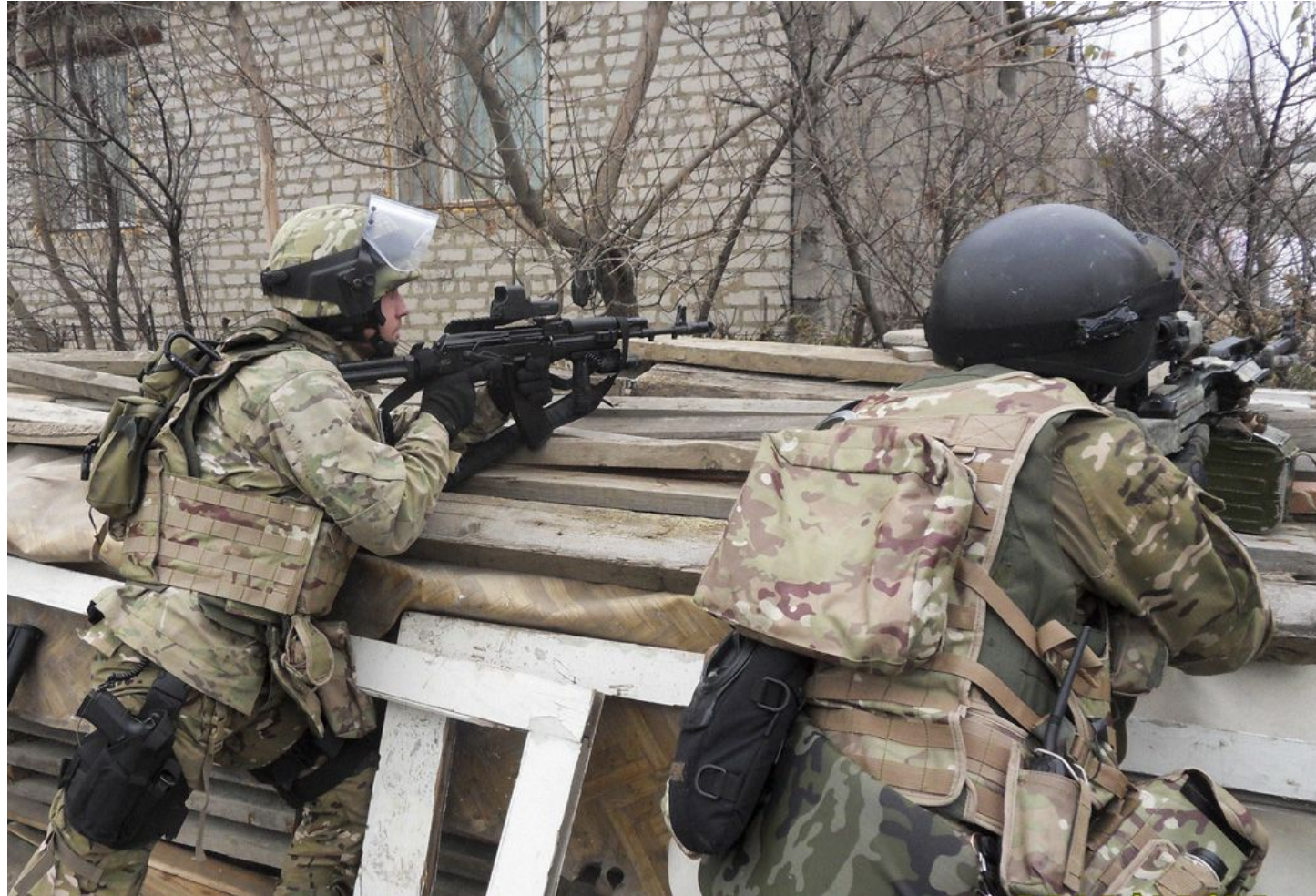
Сотрудники ЦСН ФСБ во время спецоперации в Махачкале, Республика Дагестан, 29 декабря 2010 года