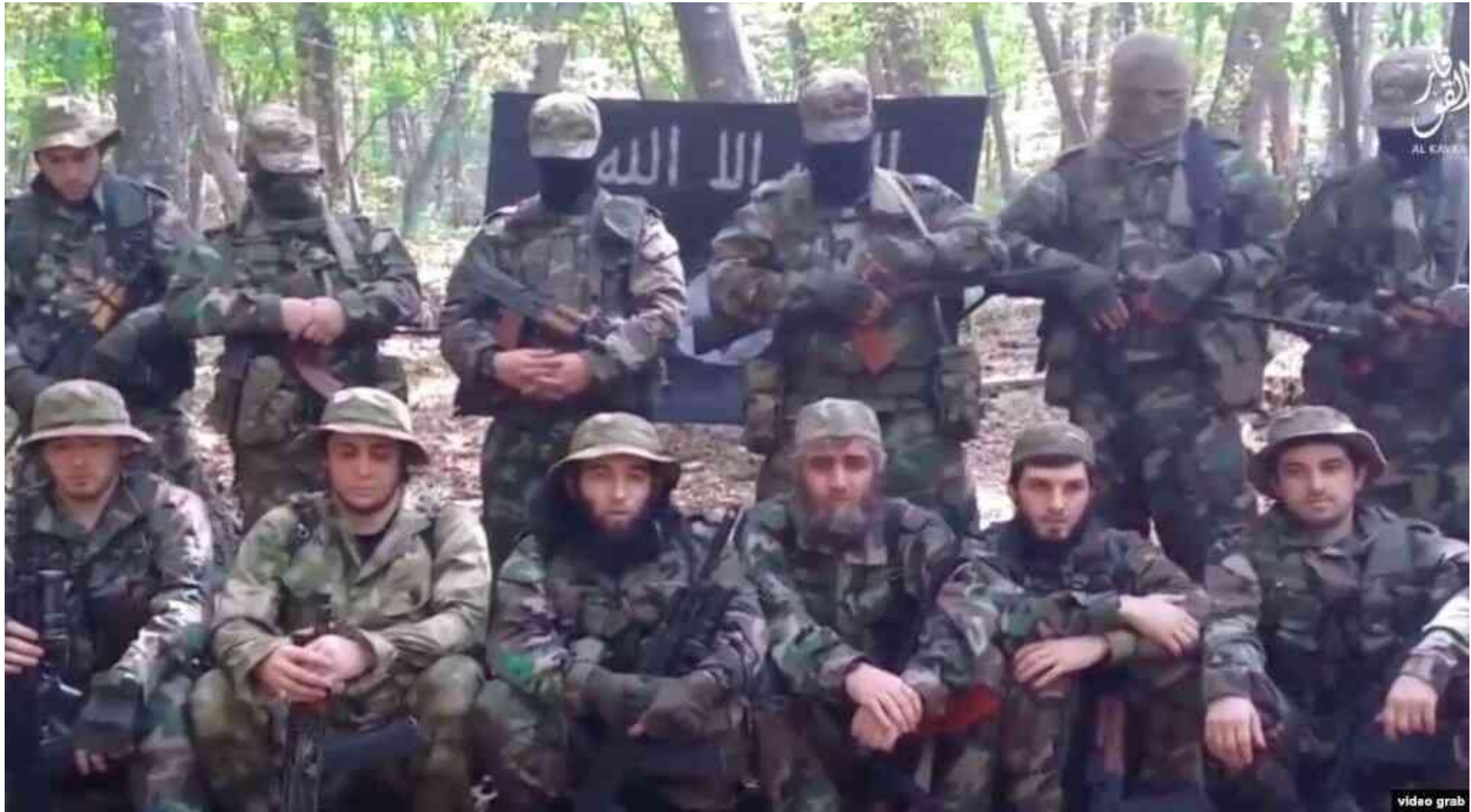
Группировка Вилаята Кавказ, 2015г