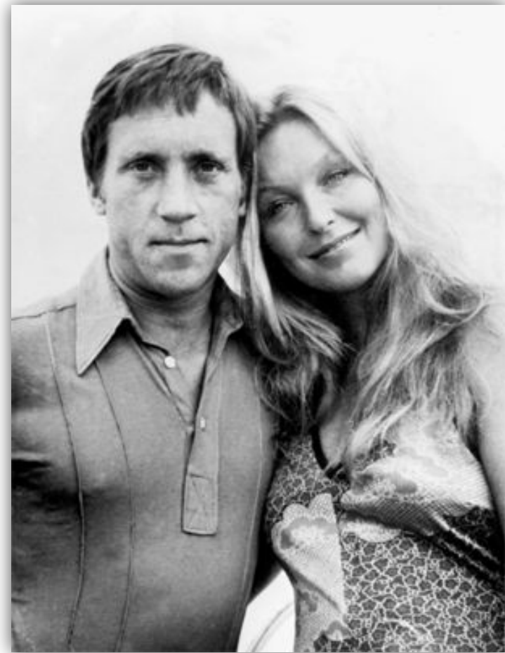
Владимир Высоцкий и Марина Влади