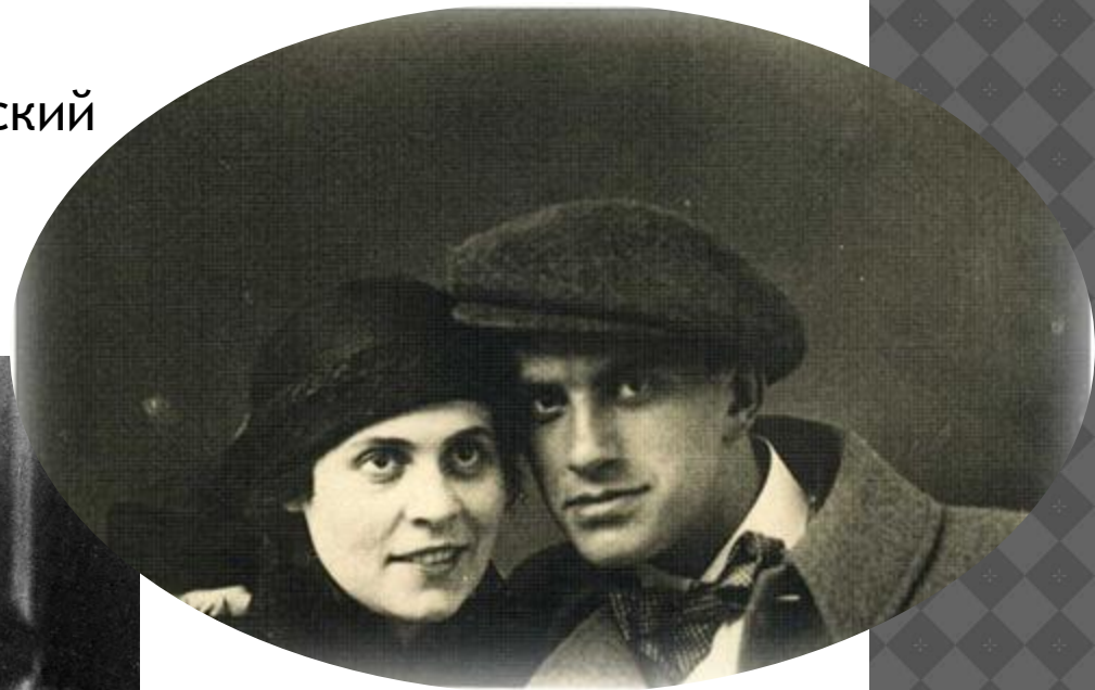
Владимир Маяковский и Лиля Брик