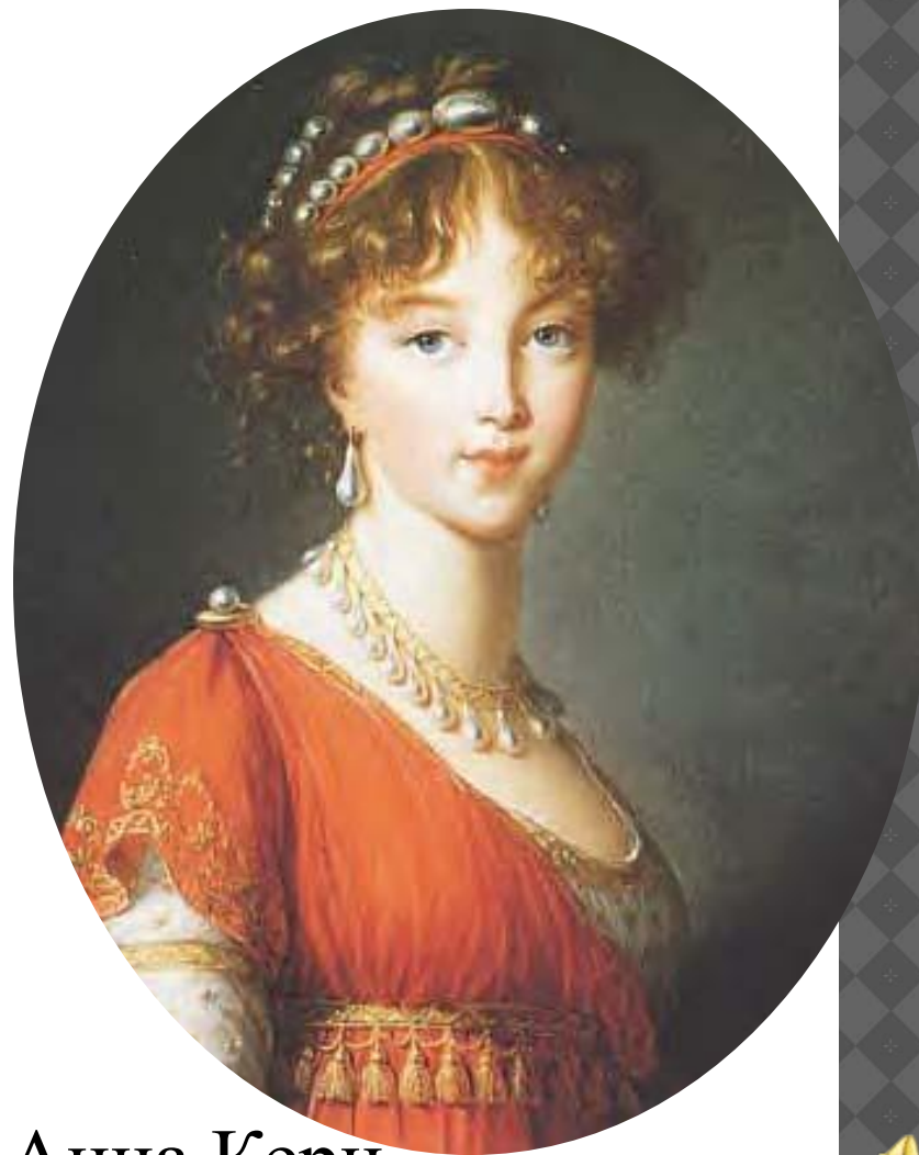
А. С. Пушкин и Анна Керн