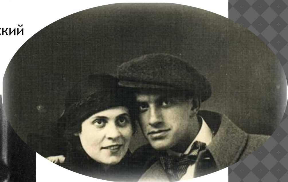
Владимир Маяковский и Лиля Брик