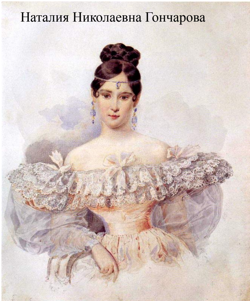
Наталия Николаевна Гончарова

Пушкин боготворил свою жену. Его восхищала не только её красота, но сдержанность, немногословность. Натали поэт посвятил много стихов. Вот одно из них, которое называется «Мадонна»