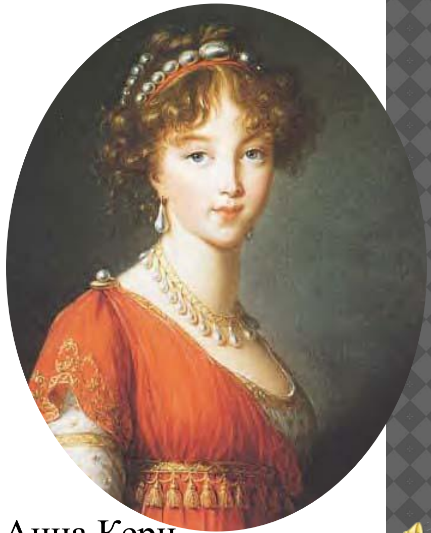
А. С. Пушкин и Анна Керн