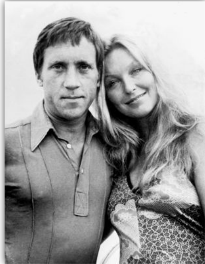
Владимир Высоцкий и Марина Влади