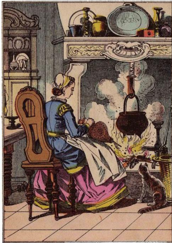
Иллюстрация к французской сказке XIX век.