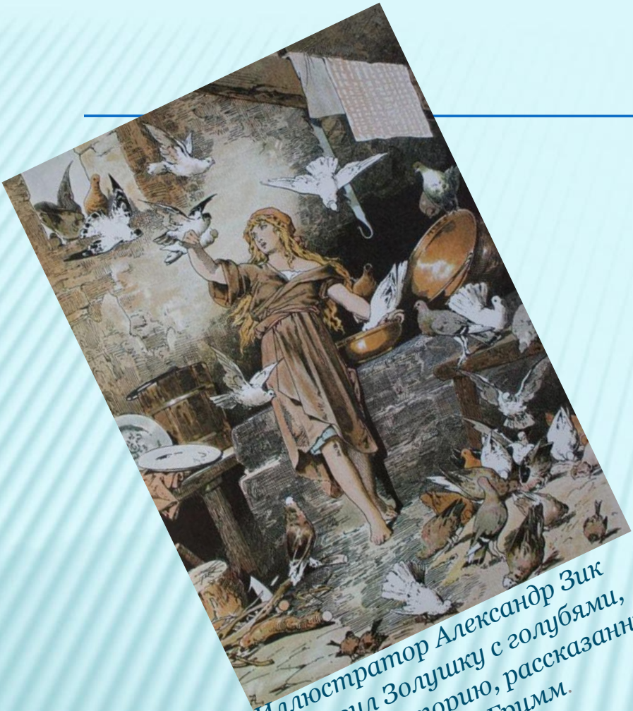
Иллюстратор Александр Зик изобразил Золушку с голубями, опираясь на историю, рассказанную братьями Гримм.