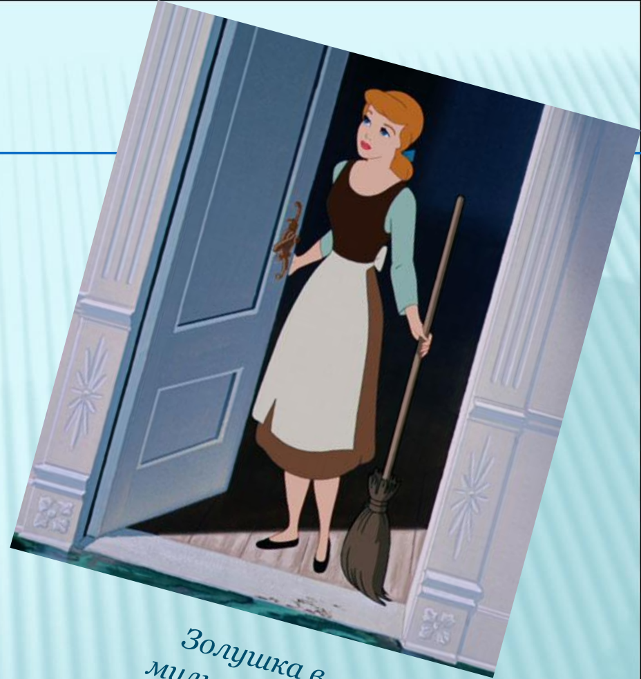
Золушка в мультфильме Диснея.