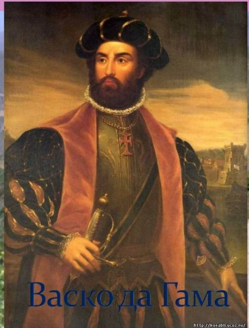
Васко да Гама