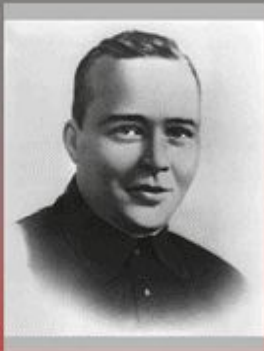
Аркадий Петрович Гайдар