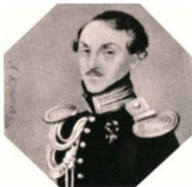
Николай Ильич Толстой, отец Льва Николаевича

Отец писателя – граф Николай Ильич Толстой – в семнадцатилетнем возрасте добровольно поступил на военную службу. Он участвовал в Отечественной войне 1812 года, попал в плен к французам и был освобожден русскими войсками, вступившими в Париж после разгрома армии Наполеона.