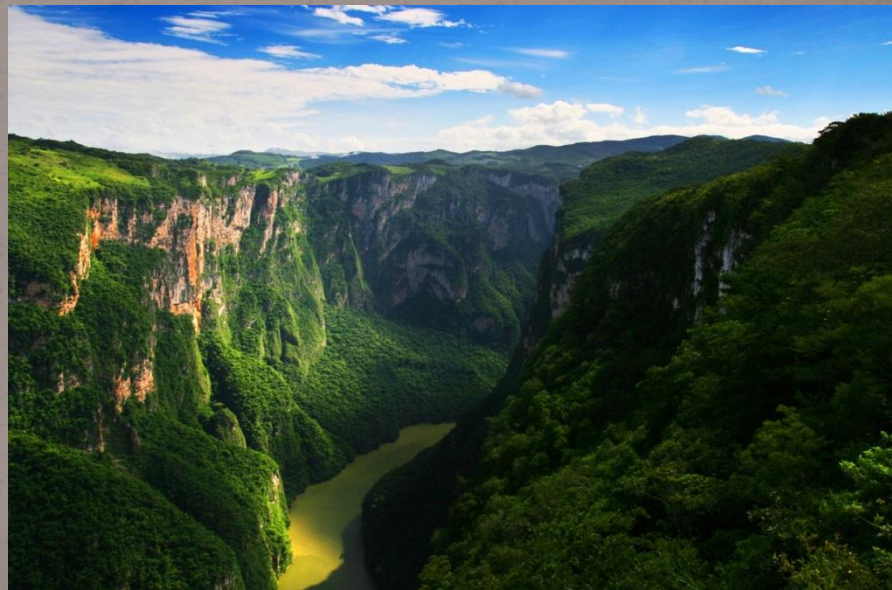
Каньон Сумидеро, Чьяпас