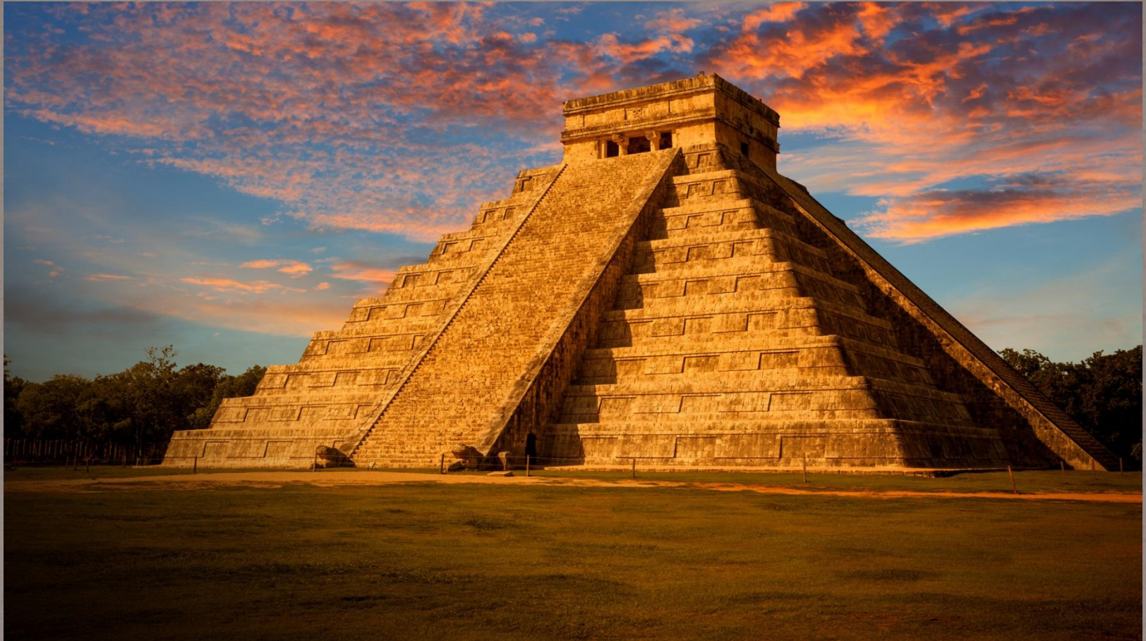
Эль Кастилло (Пирамида Кукулькана)