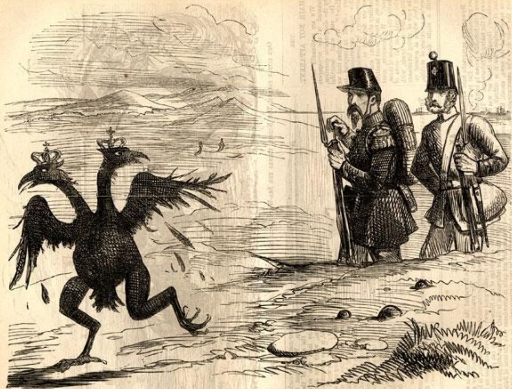
THE SPLIT CROW IN THE CRIMEA. He's Hit Hard!—Follow Him Up!

Карикатура в лондонском журнале «Панч», 29 сентября 1855. Французский и британский солдаты смотрят на убегающего двуглавого орла. Подпись под рисунком: «Двуглавая ворона в Крыму. Она получила жестокий удар! Гонись за ней!»