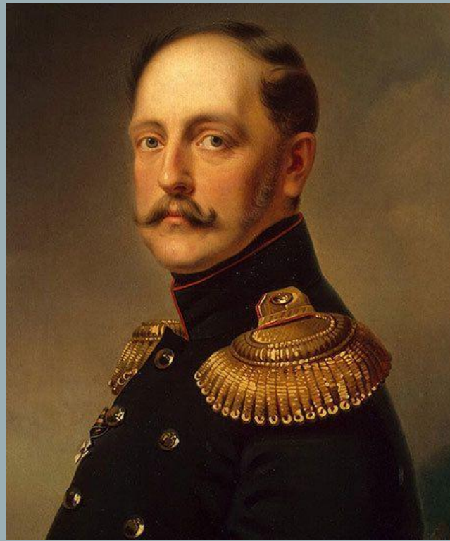
Николай I (1796-1855)