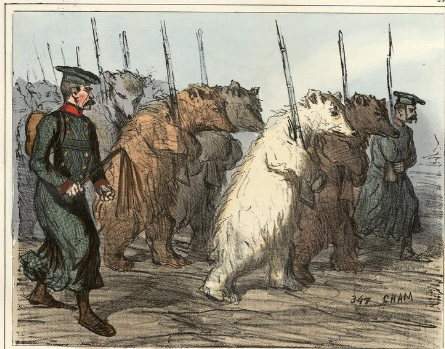
L'armée de réserve de l'empereur de Russie.

Карикатура в лондонском журнале «Панч», 29 сентября 1855. Французский и британский солдаты смотрят на убегающего двуглавого орла. Подпись под рисунком: «Двуглавая ворона в Крыму. Она получила жестокий удар! Гонись за ней!»