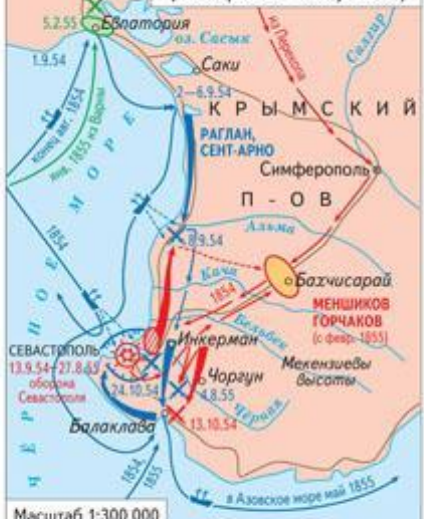
Масштаб 1:300 000