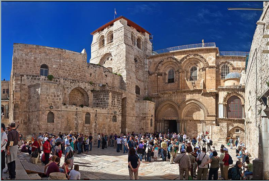
Вифлеемский храм Рождества Христова