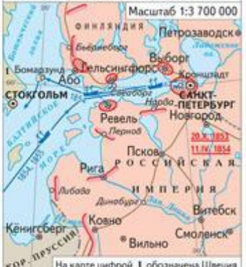
На карте цифрой 1 обозначена Швеция