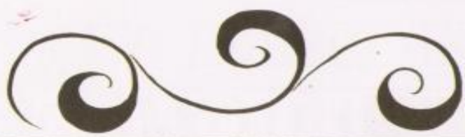
ВЕДУЩИЙ СТЕБЕЛЬ — «КРИУЛЬ»