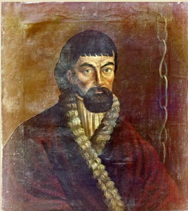
Емельян Иванович Пугачёв (1742–1775 гг.)