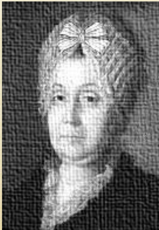
Мария Алексеевна Ганнибал