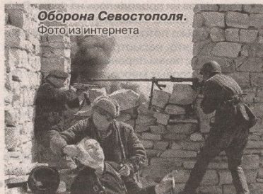
Оборона Севастополя.