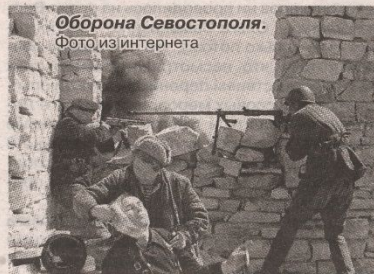
Оборона Севастополя.