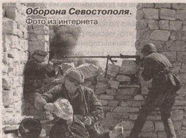
Оборона Севастополя.