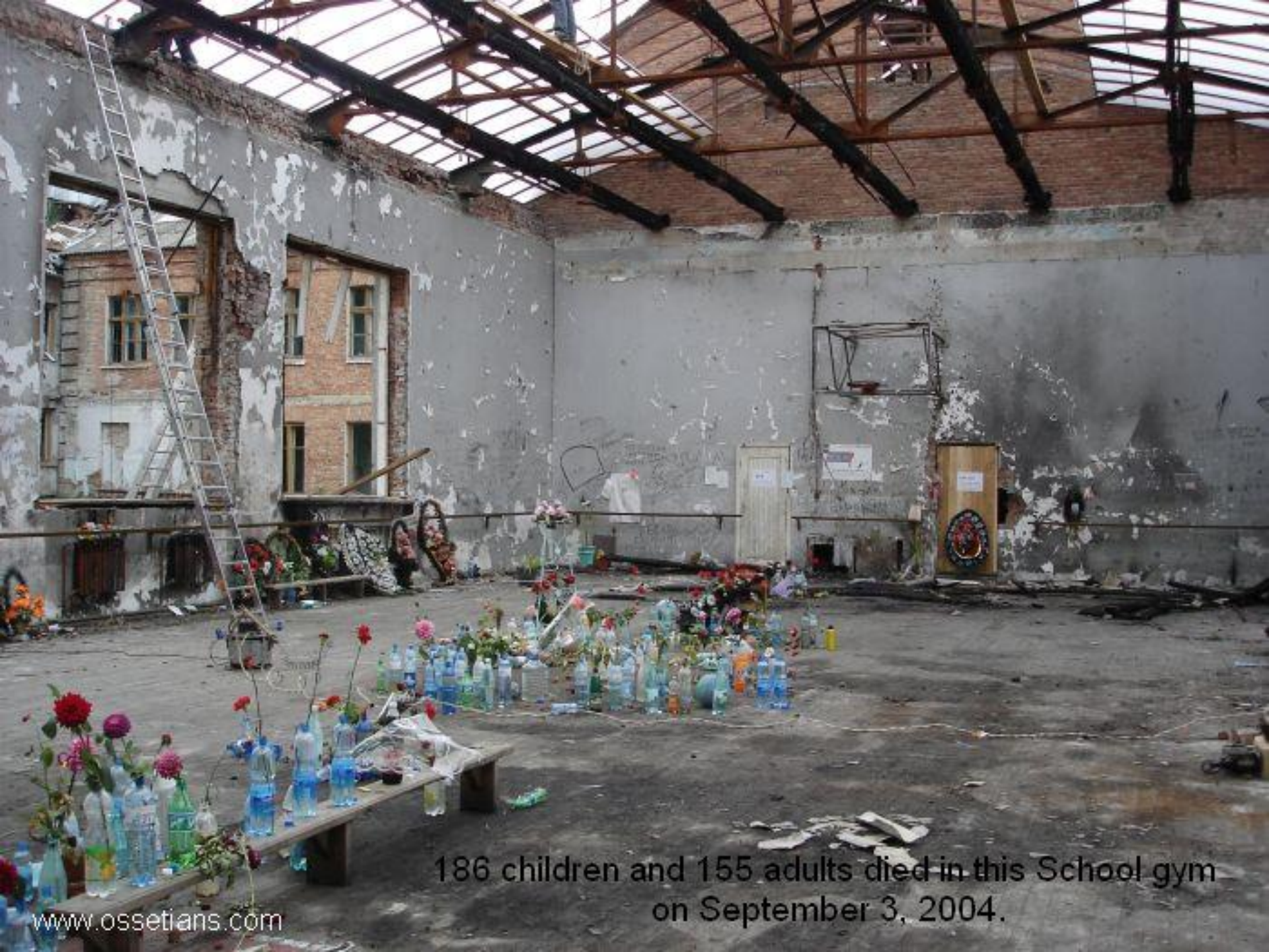
186 children and 155 adults died in this School gym on September 3, 2004.