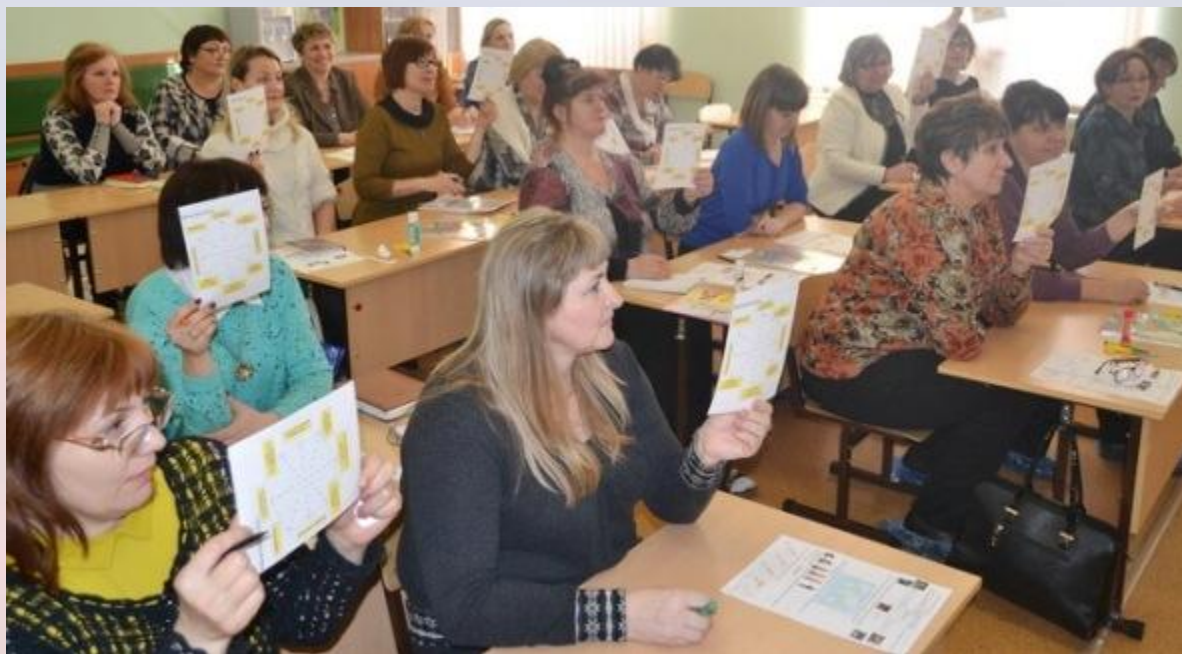
На семинаре учителей начальных классов

Закон «Об образовании в РФ» регламентирует отношения между сторонами в сфере образовательных отношений. Содержание статей соответствует Конституции.