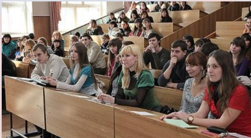
Студенты на лекции

Преподаватели будут обучаться оказанию неотложной помощи : освоят порядок действий и приобретут необходимые навыки.