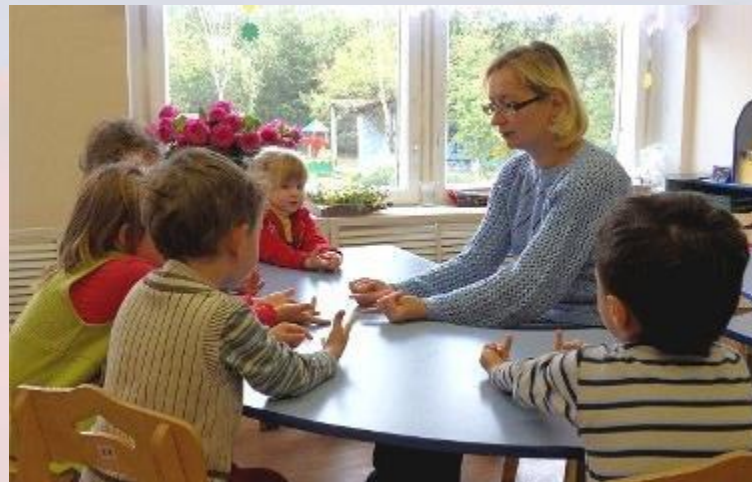
На занятии в детском садике

По новому закону о дошкольном образовании в РФ в детских садах не проводится итоговая аттестация . Соответствие стандартам должно волновать не малышей, а родителей и преподавателей.