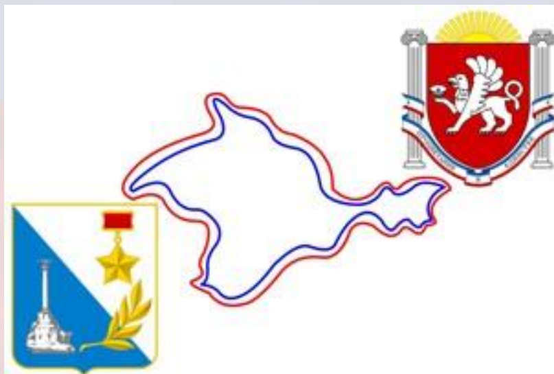
Гербы Севастополя и Крыма