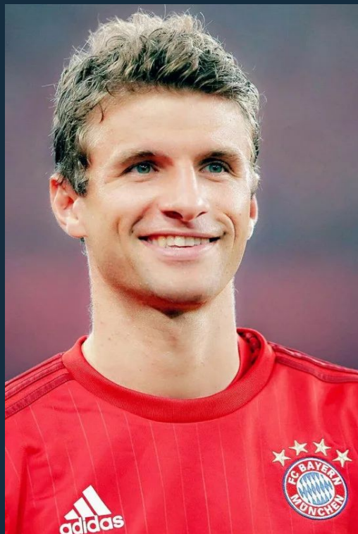
Томас Мюллер Бавария

Верные игроки останутся на слайде. Те, кто переходил, выпадут за его пределы.