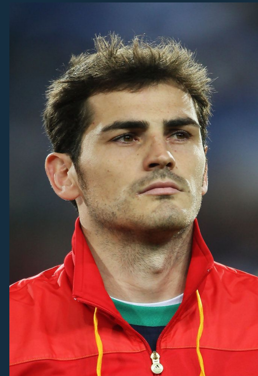
Икер Касильяс Реал Мадрид