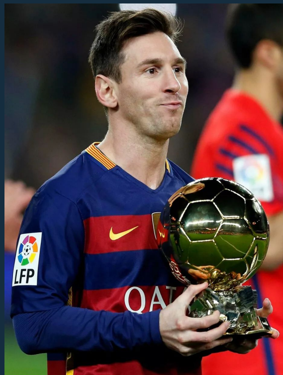
Лео Месси Барселона