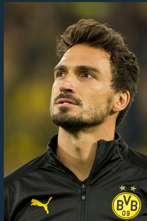
Матс Хуммельс Боруссия Дортмунд