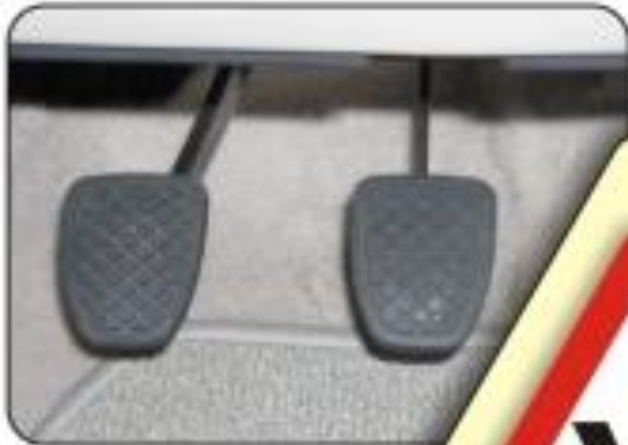
Дополнительные педали сцепления и тормоза