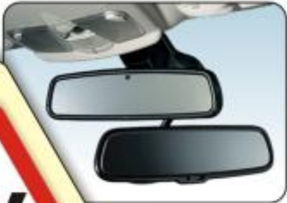
Дополнительное зеркало заднего вида