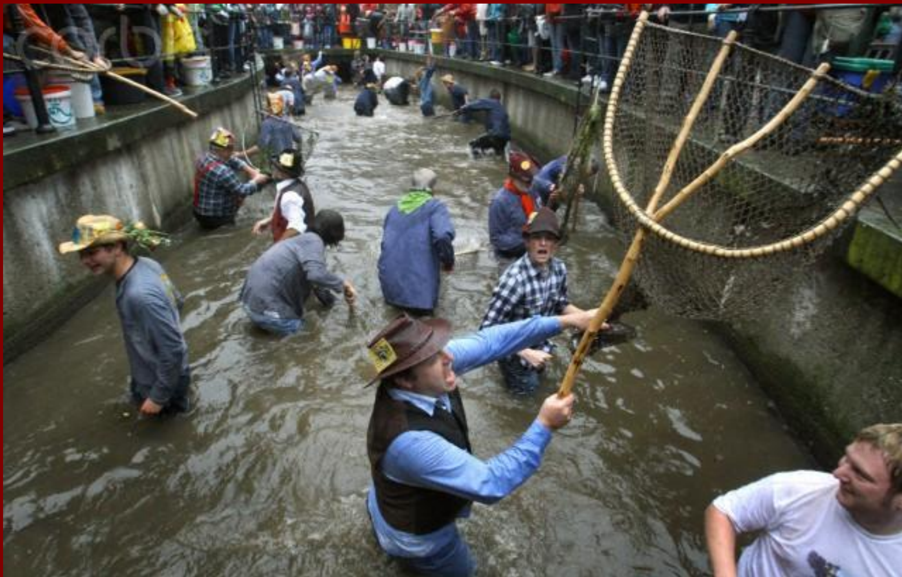
Форельный день в Меммингене