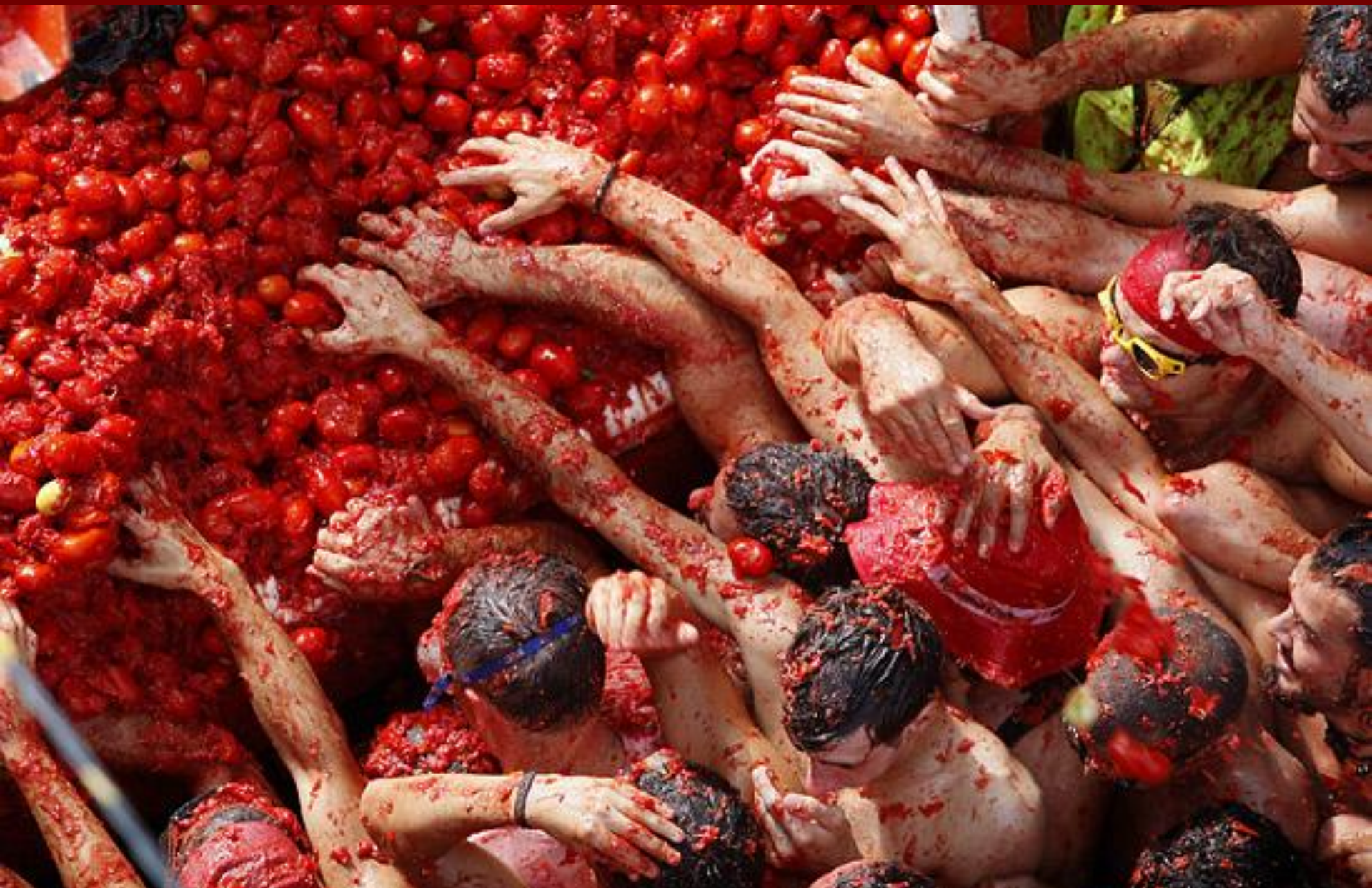
La Tomatina, Buñol, Spain: last Wednesday in August