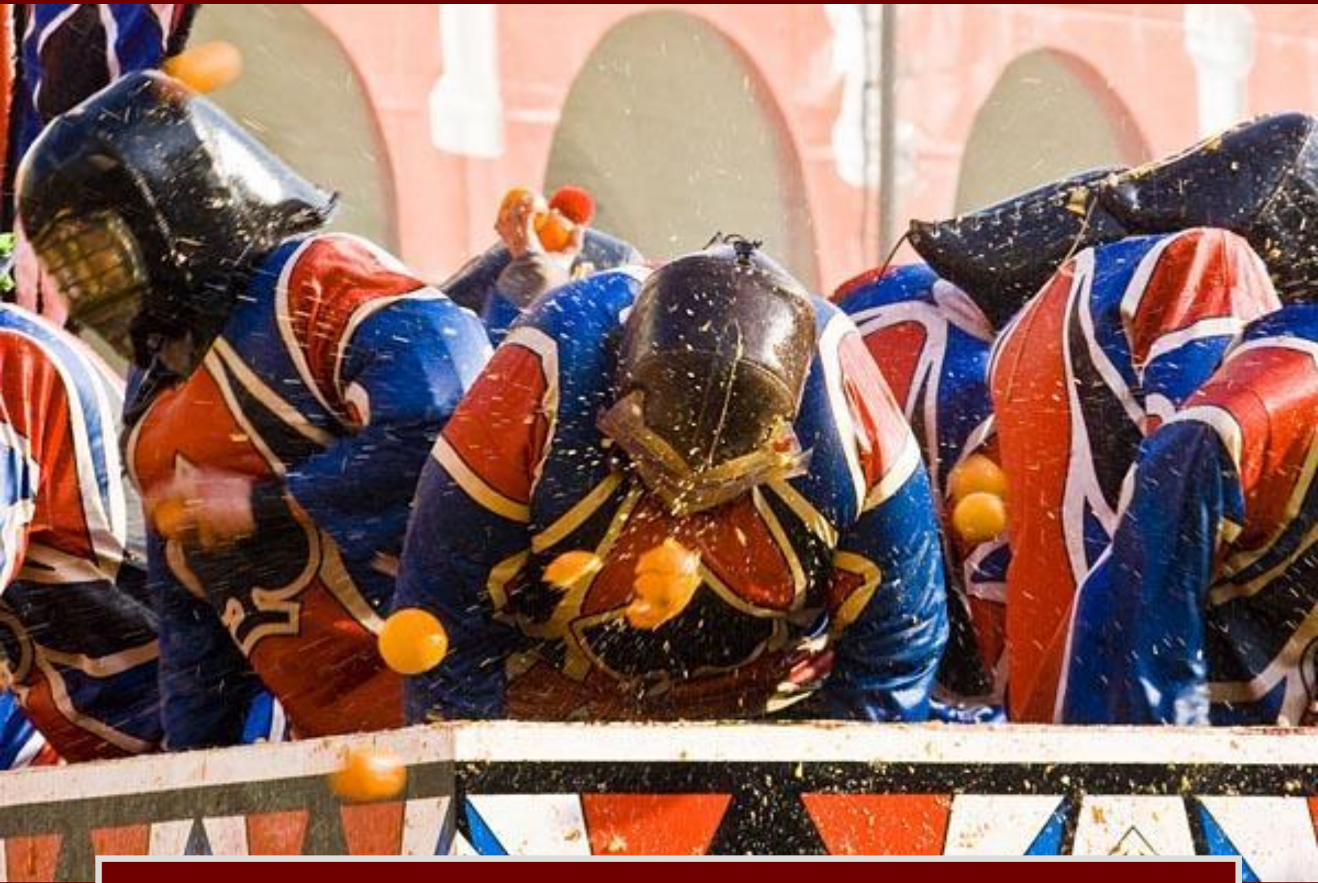
The Battle of the Oranges, Ivrea, Italy: February