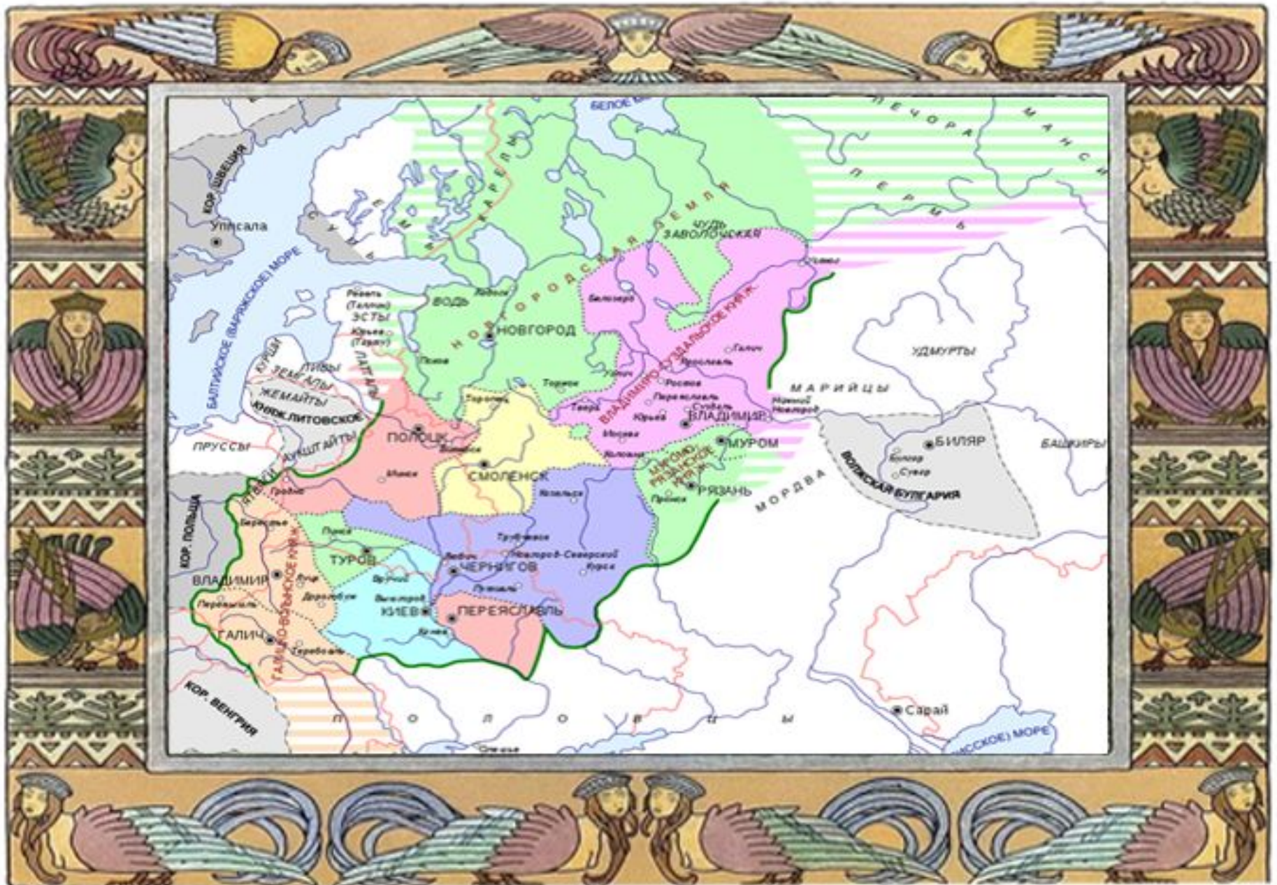
Удельные княжества к 1237 г.