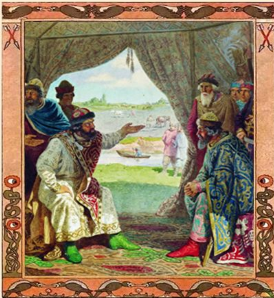
Любечский съезд князей 1097 г.