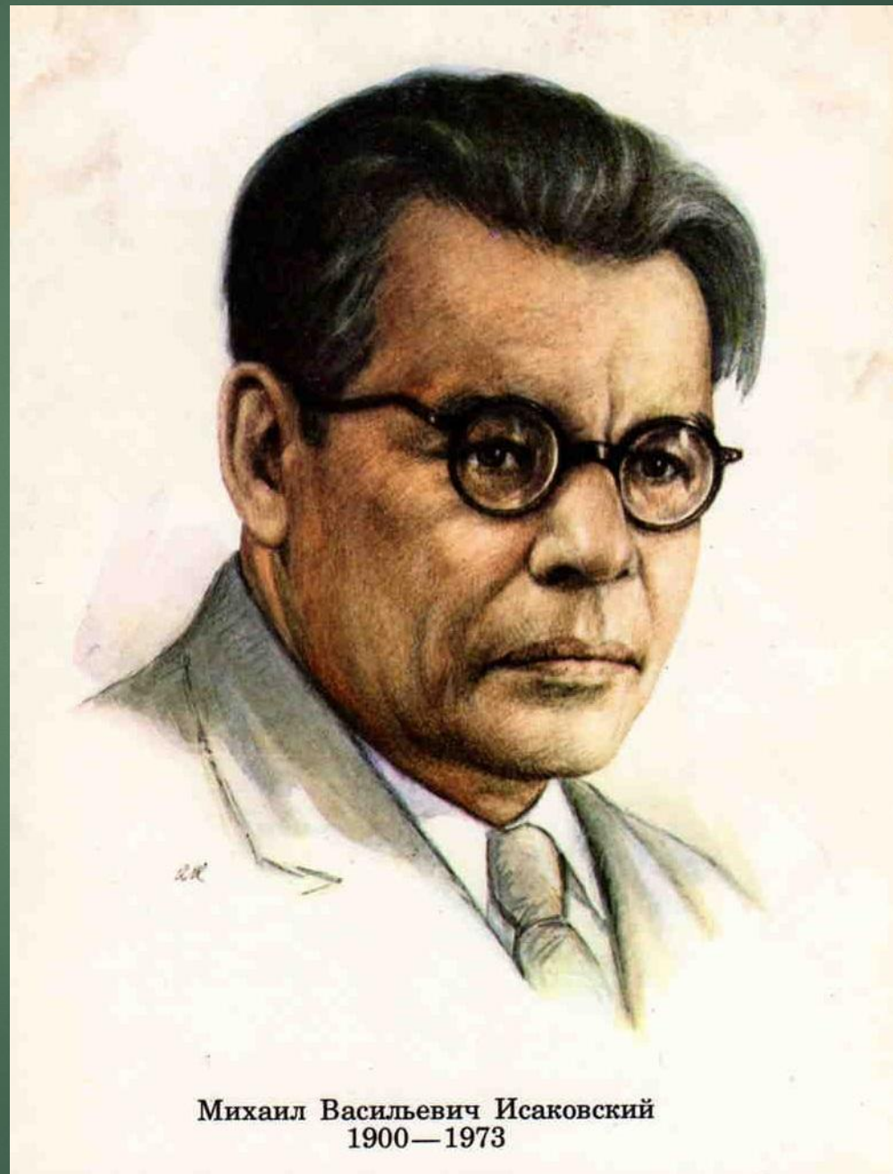
Михаил Васильевич Исаковский 1900—1973