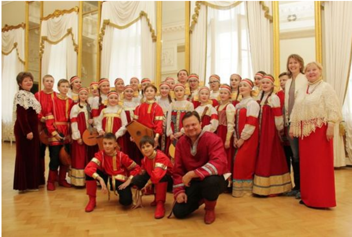
Образцовый детский коллектив Санкт-Петербурга Ансамбль народного творчества «Таусень» ГБУ ДО ДДЮТ Фрунзенского района 2021