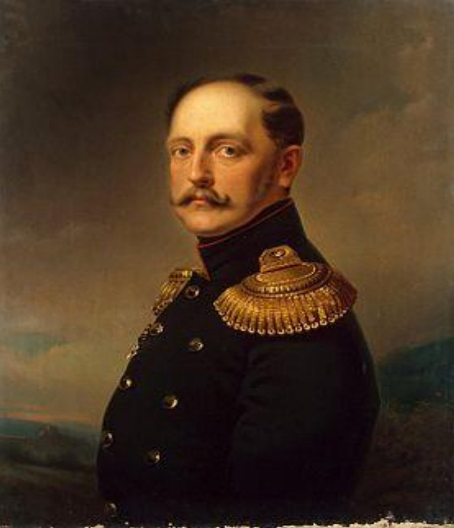
Николай I годы правления (1825-1855).