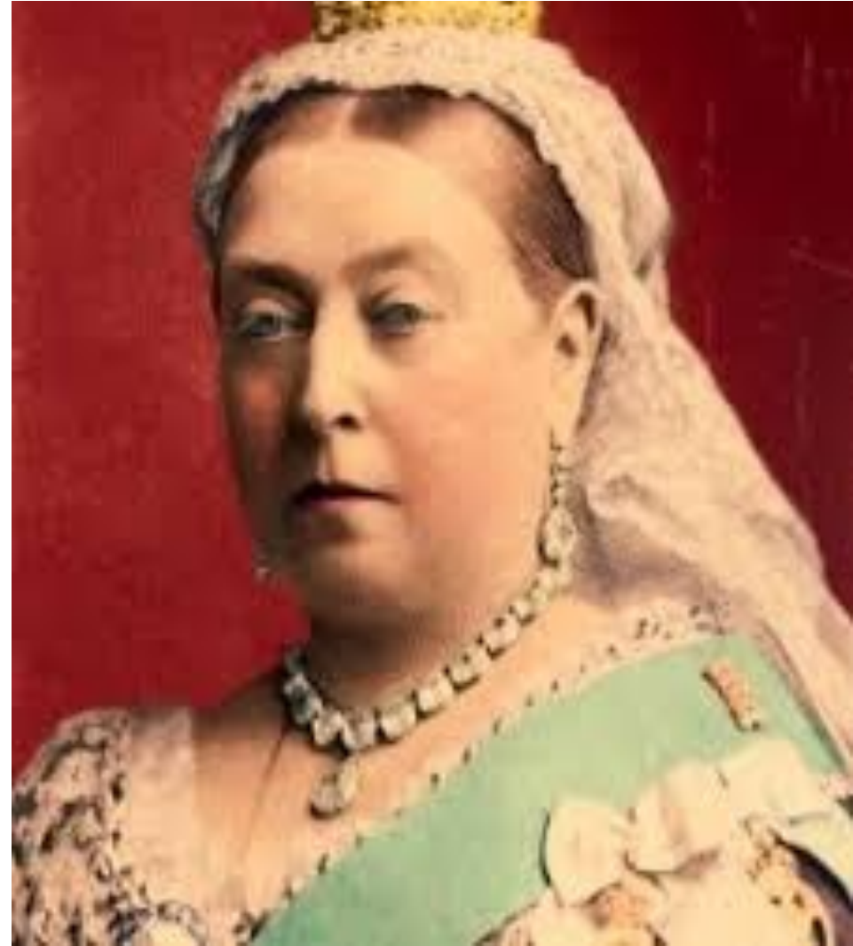
Виктория годы правления 1837-1901, императрица Индии 1876 г. - 1901