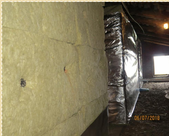
Теплоизоляция вентиляционной шахты