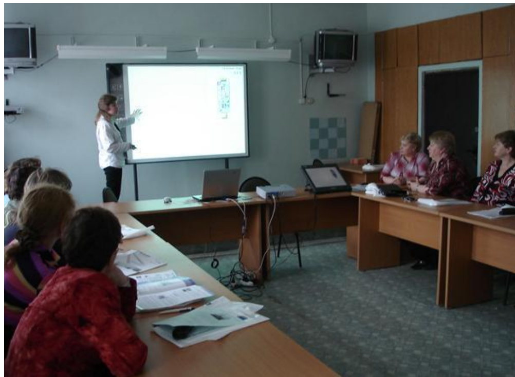
Интерактивная доска Медиацентр