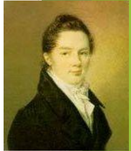
Иван Иванович Пушин

Пушкин сохранил лицейскую дружбу на всю жизнь.