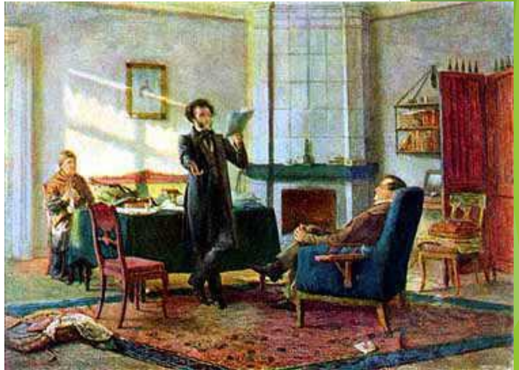
Пушкин в селе Михайловском (Пушкин у Пушкина). Н.Н. Ге. 1875 г.

Во время ссылки написаны "Кавказский пленник" , "Бахчисарайский фонтан" , а также "Узник" , "Песнь о Вещем Олеге" . Начат роман в стихах "Евгений Онегин" .