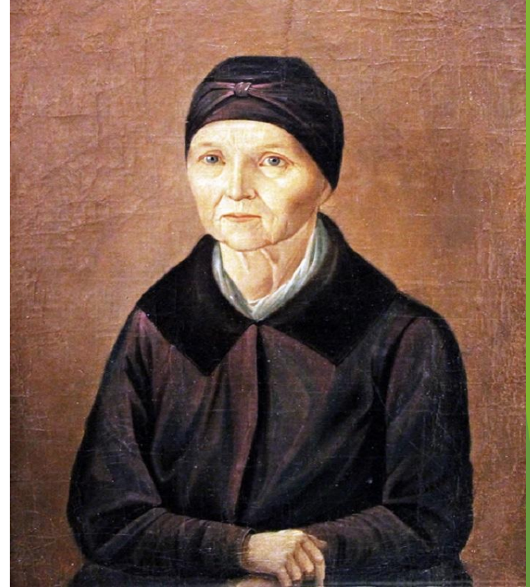
Яковлева Арина Родионовна

Любовь к родному языку маленькому Пушкину привили бабушка, Мария Алексеевна Ганнибал, превосходно говорившая и писавшая по-русски, и няня Арина Родионовна.