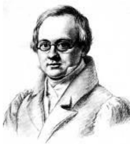
Антон Антонович Дельвиг