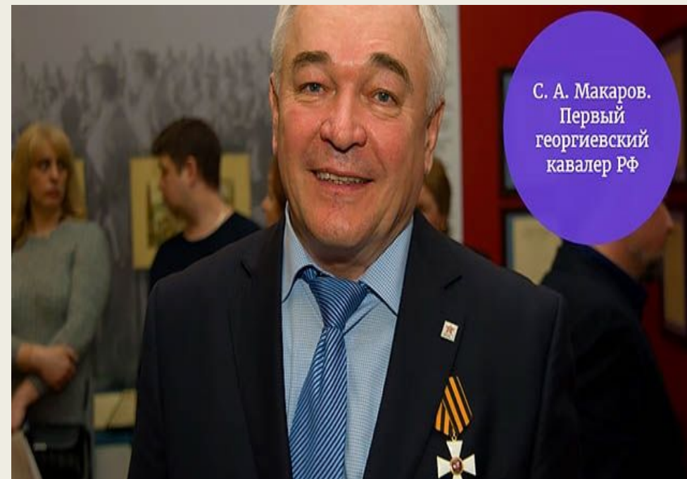
С. А. Макаров. Первый георгиевский кавалер РФ

[ОВУ] Восстановленный орден обладает теми же внешними признаками, что и в имперское время, но все степени в нём даются последовательно.