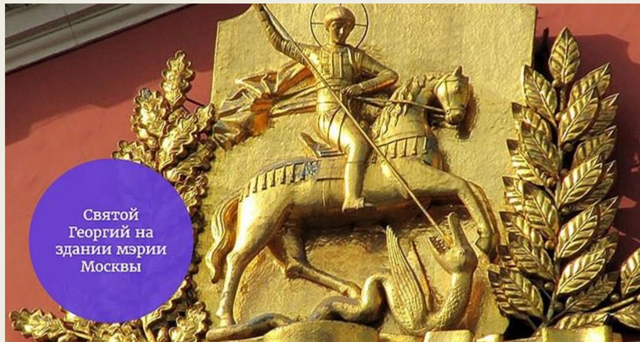
Святой Георгий на здании мэрии Москвы

По новому стилю праздник приходился на 7 декабря в XVIII веке, 8 декабря в XIX веке, 9 декабря в XX веке. В XXI веке этой дате также соответствует 9 декабря.