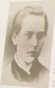
А.С. Голубкина. Фотография. 1882 Anna Golubkina. Photo. 1882

Неузнанным, но, несомненно, уникальным и неординарным художественным явлением в деятельности Голубкиной, тяготеющей к работе в монументальной форме, являются камеи из морской раковины и слоновой кости. Уже первые попытки определить количество миниатюр, вырезанных в разные годы, и осмыслить их место в творчестве мастера, позволили заключить, что камеи представляют собой параллельное направление рядом с хорошо известным станковым искусством скульптора.