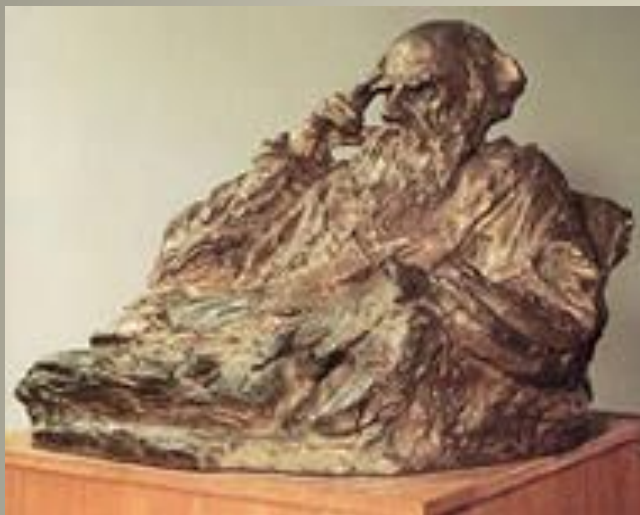
«Л.Н. Толстой» – последняя работа скульптора.

Последняя ее работа — «Лев Толстой» — косвенно стала причиной смерти художницы. Она намеревалась выполнить вариант композиции в дереве. Это был массивный блок из дерева, а Голубкиной было запрещено поднимать тяжелое после перенесенной операции в 1922 году. Забыв о здоровье и возрасте, она резко подвинула его и вскоре почувствовала себя нехорошо. Решила поехать к сестре в Зарайск — считала, что сестра сумеет вылечить.