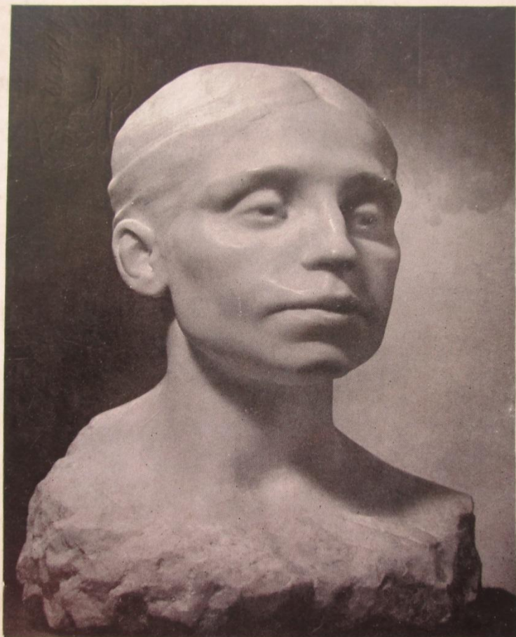
А. С. ГОЛУБКИНА