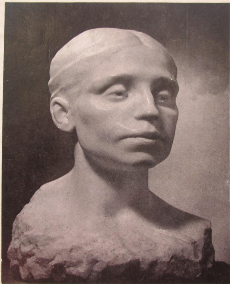
А. С. ГОЛУБКИНА