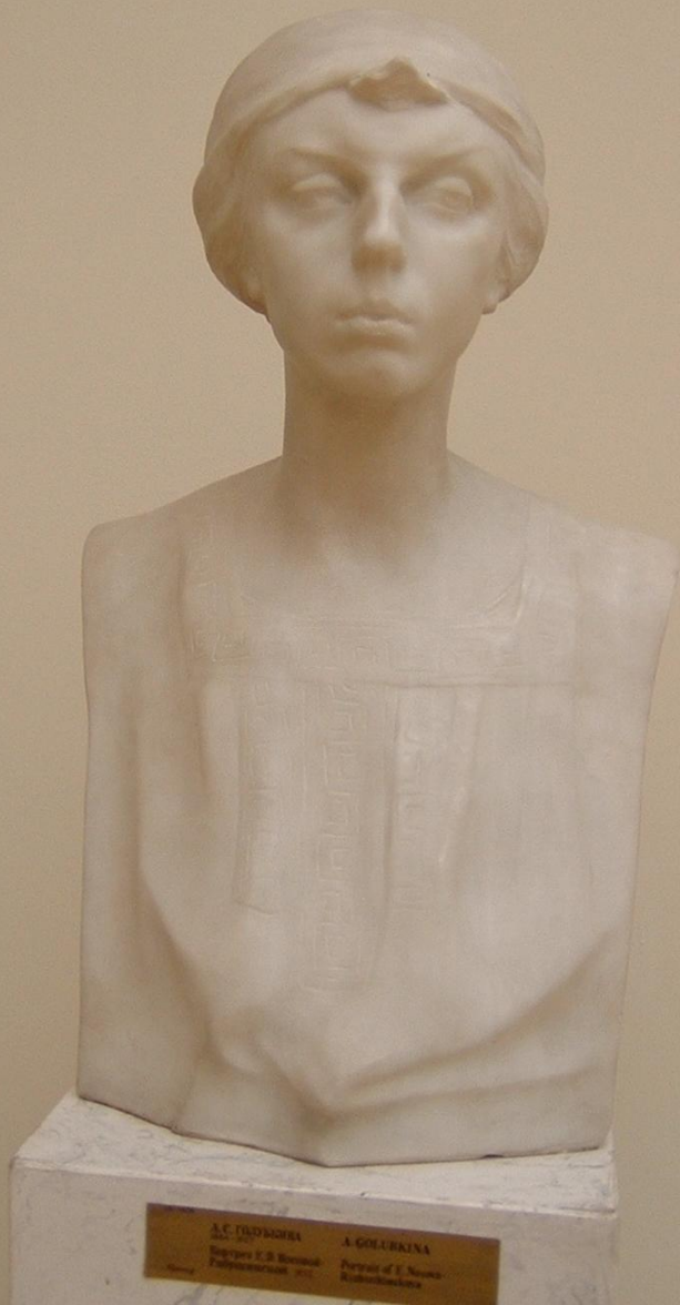
Портрет Е.П. Носовой. 1912. Мрамор.