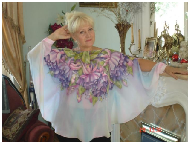
Автор Назарова Галина