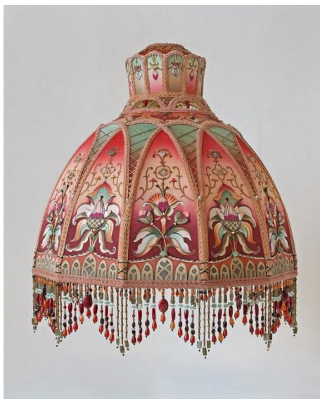
Абажур. Автор Ева Шадрина