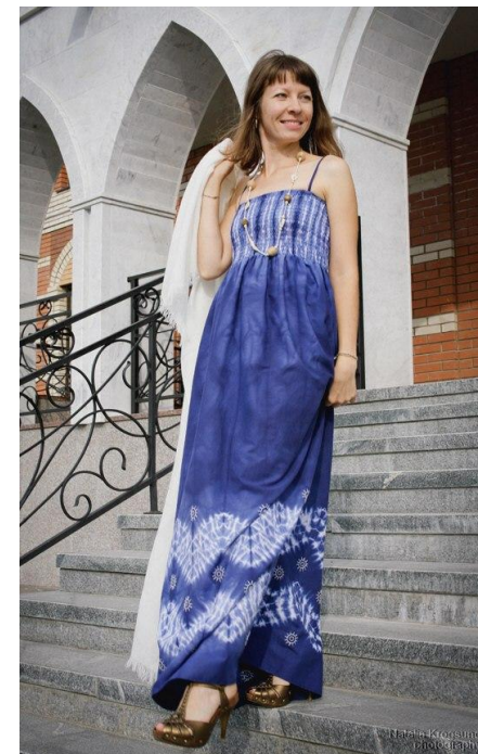
Автор Елена Бородина