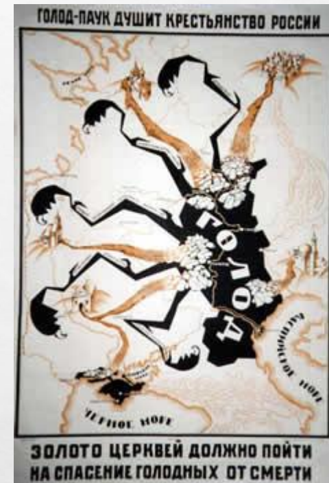
Плакат помощи голодающим регионам РСФСР «Голод-паук душит крестьянство России».