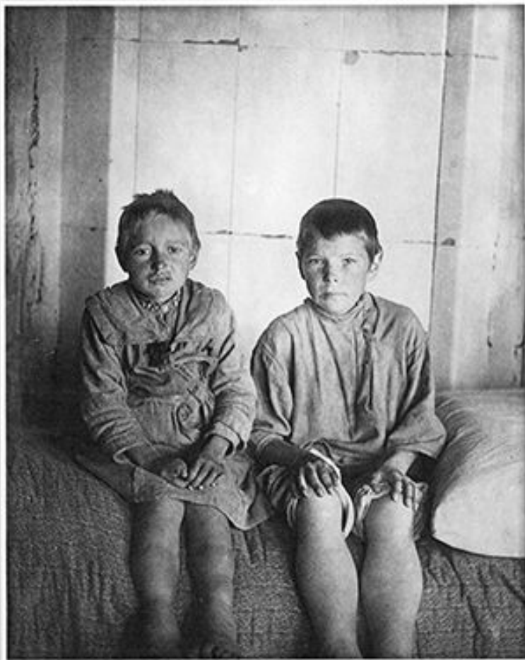
Опухшие от голода мальчик и девочка, эвакуированные из села.