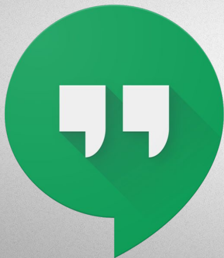
Google Hangout (Гугл видео-чат)