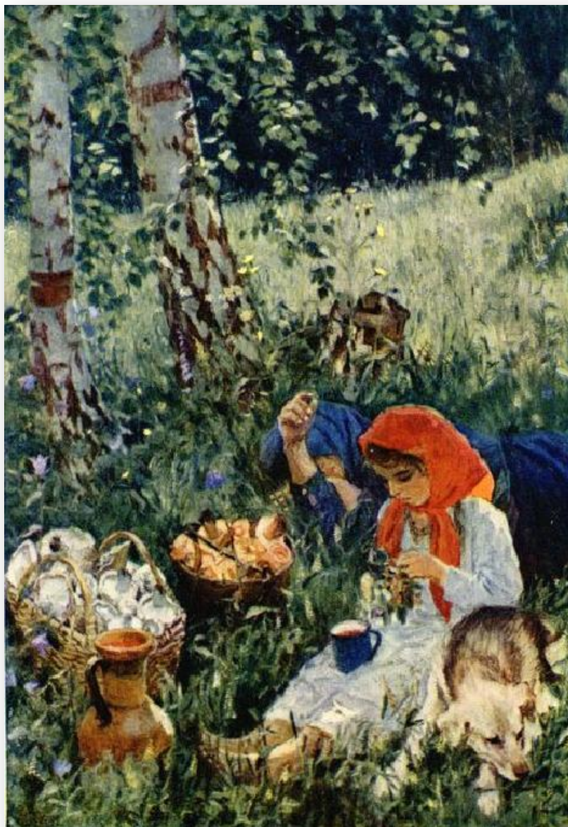
А. А. Пластов «Летом»