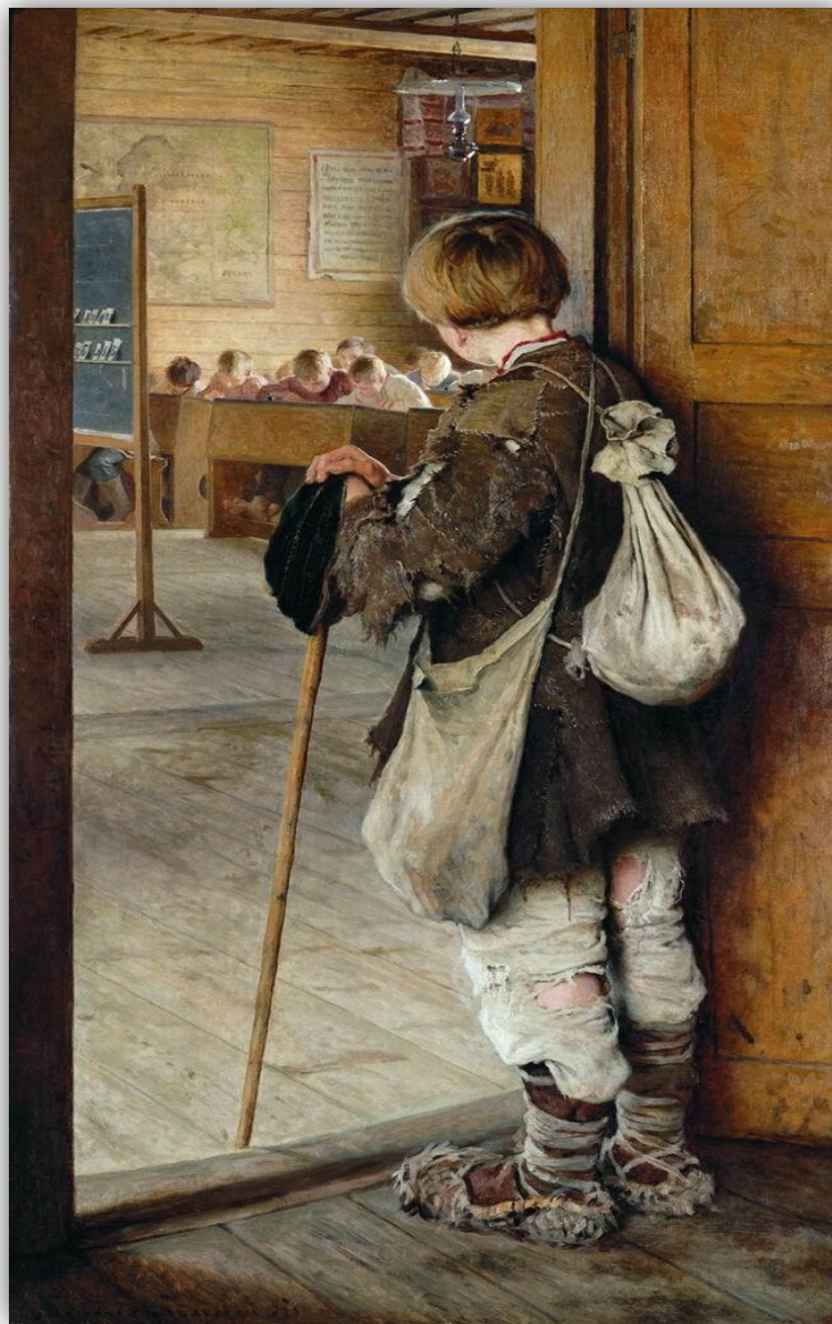
Н.П. Богданов-Бельский «У дверей школы»