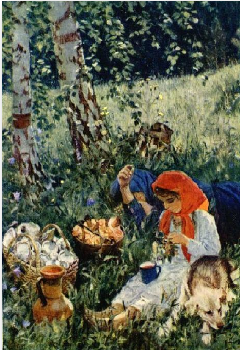
А. А. Пластов «Летом»