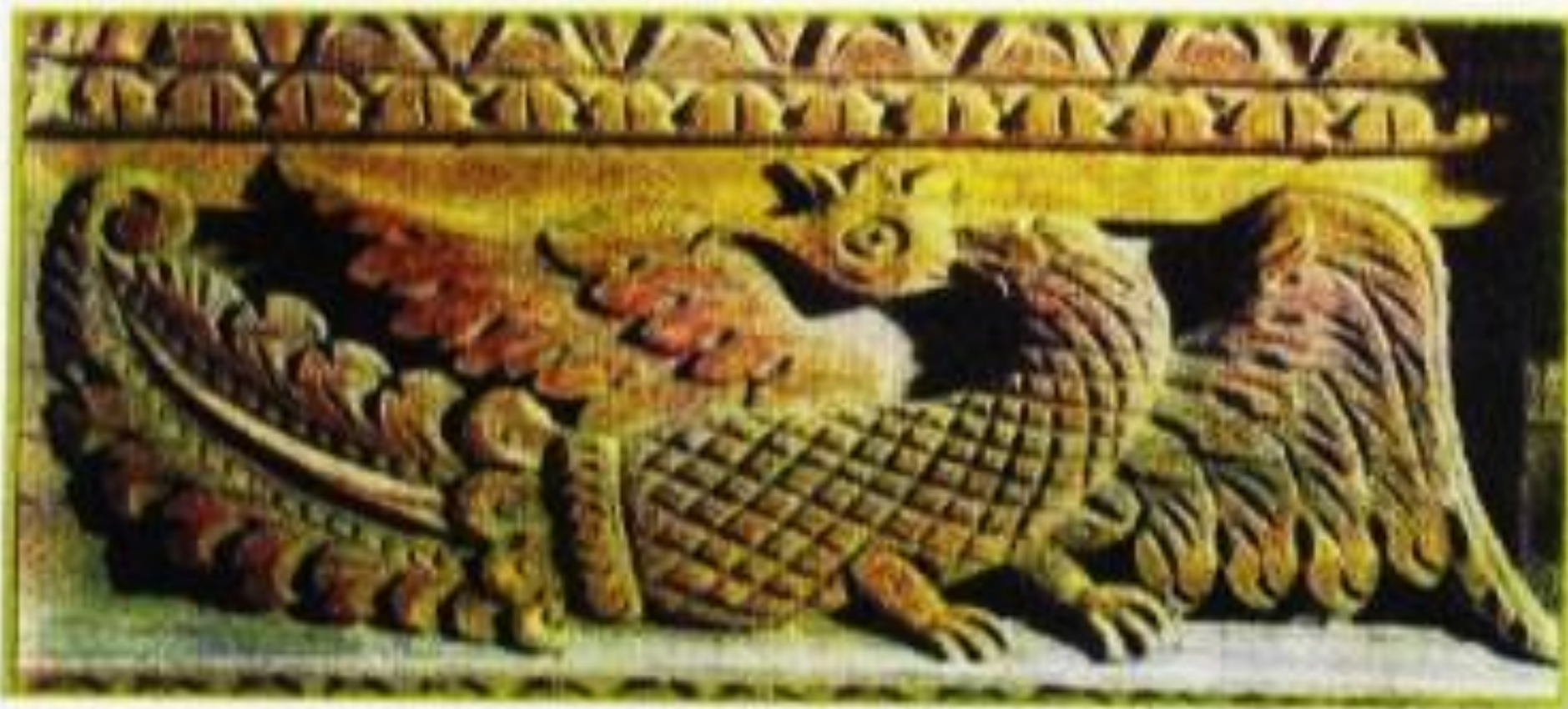
Образы животных в деревянной резьбе