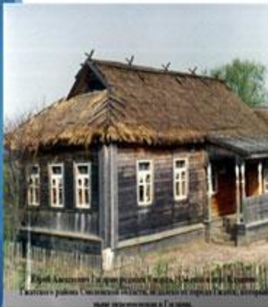
Юрий Алексеевич Гагарин родился 9 марта, 1934 года в деревне Клушино Гжатского района Смоленской области, не далеко от города Гжатск, который ныне переименован в Гагарин.

Родился Юрий Алексеевич Гагарин в городе Гжатске Смоленской области. Теперь этот город переименован и назван именем героя-Гагарин. Детство Юры прошло в деревне Клушино, что недалеко от города.