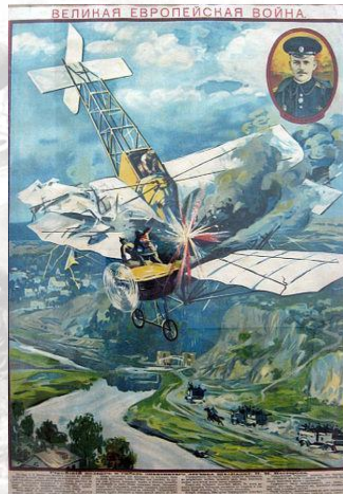
Плакат времён Первой мировой войны «Подвиг и гибель лётчика Нестерова»

Нестеров осуществлял воздушную разведку, выполнил одну из первых в России бомбардировок приспособленными для этого артиллерийскими снарядами. Осуществив за время войны 28 вылетов, 8 сентября 1914 года около городка Жолква Пётр Николаевич Нестеров совершил свой последний подвиг — протаранил самолёт , в котором находились пилот Франц Малина и пилот-наблюдатель барон Фридрих фон Розенталь, которые вели воздушную разведку передвижения русских войск.