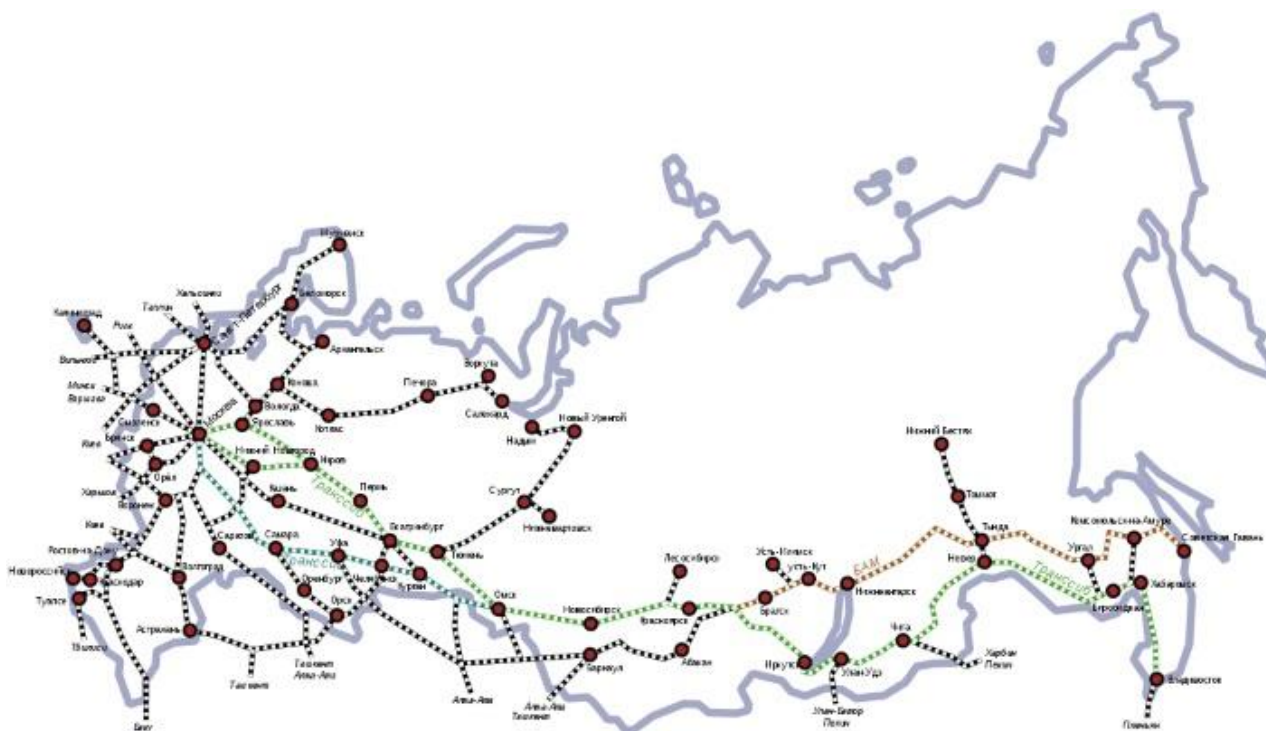
Транспортные магистрали России