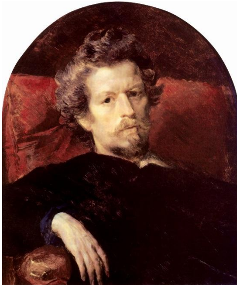
К.П. Брюллов, автопортрет