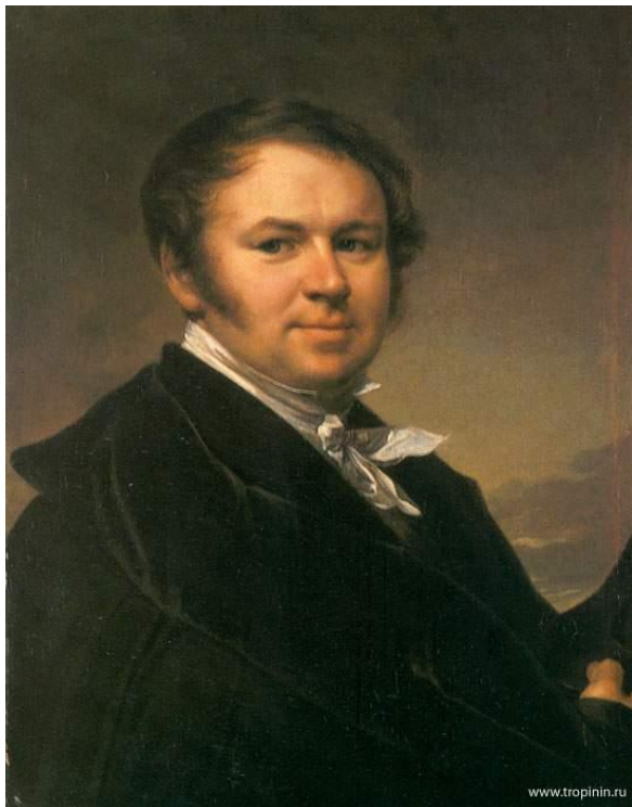
В.А. Тропинин, автопортрет