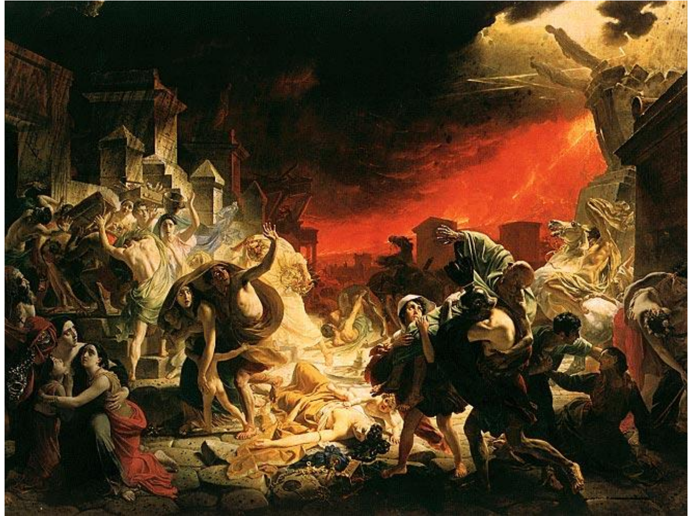
К.П. Брюллов «Последние дни Помпеи»