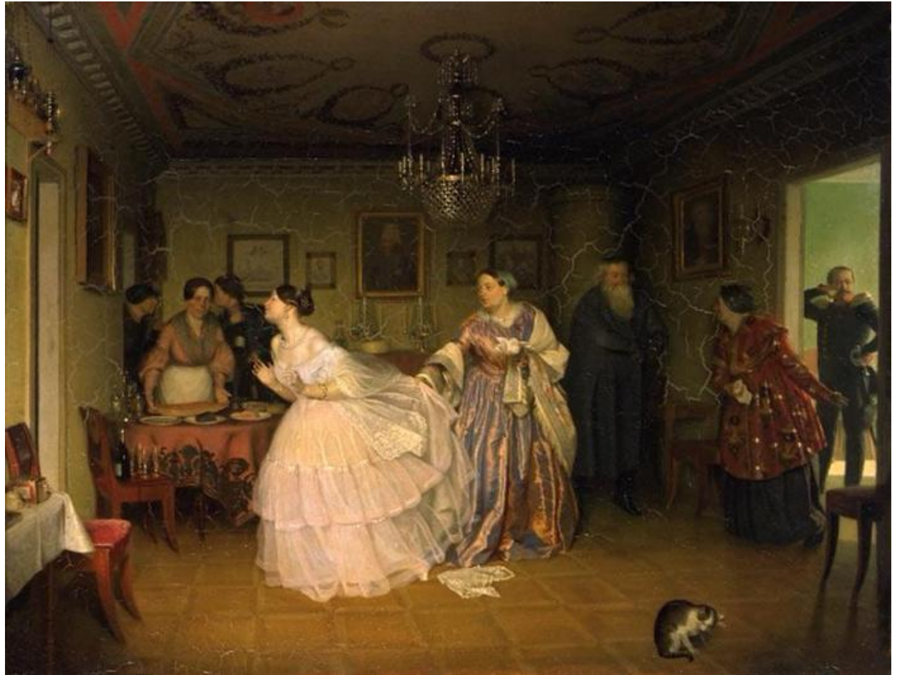
П.А.Федотов «Сватовство майората»