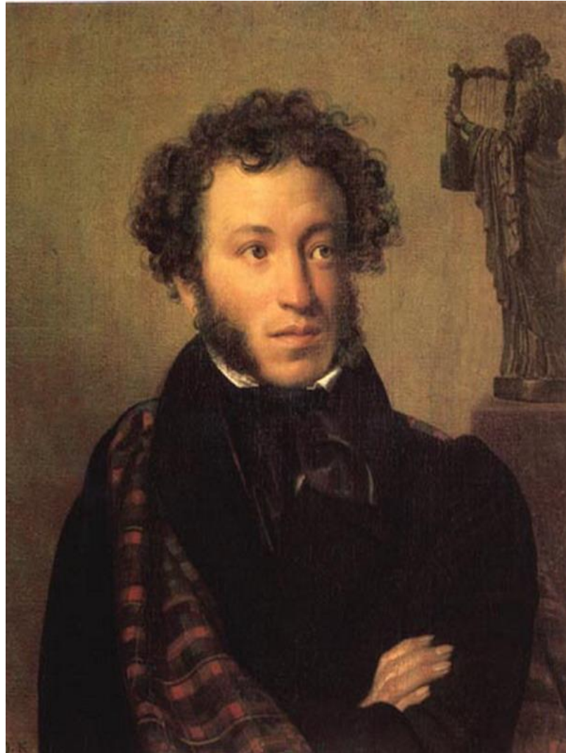
О.А.Кипренский портрет А.С. Пушкин