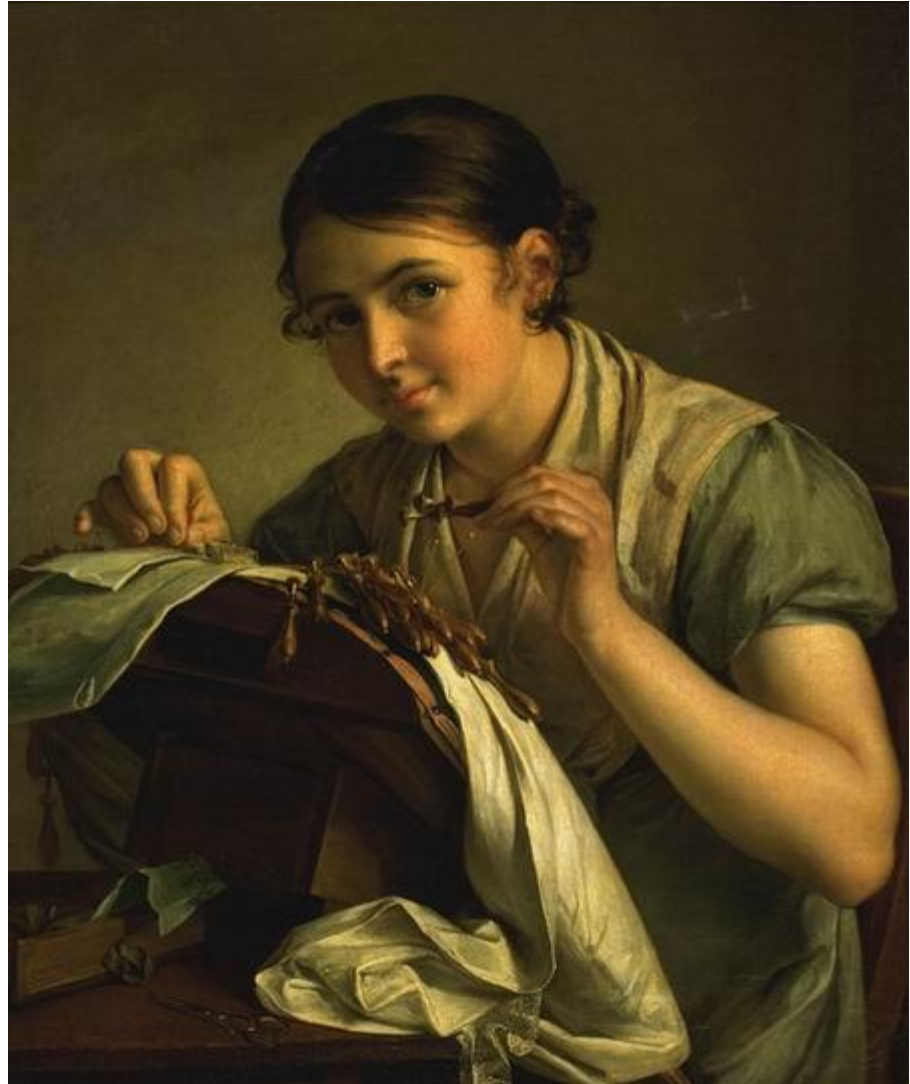
В.А. Тропинин, Кружевница