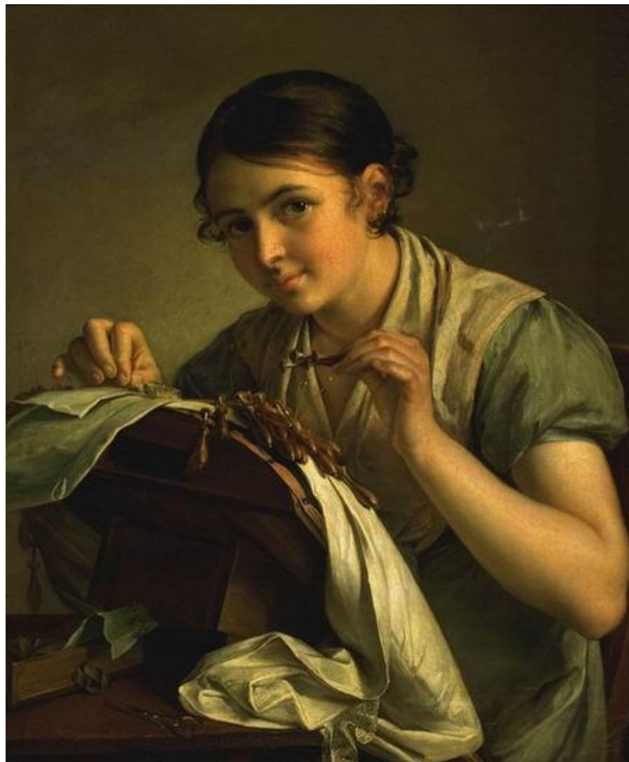
В.А. Тропинин, Кружевница